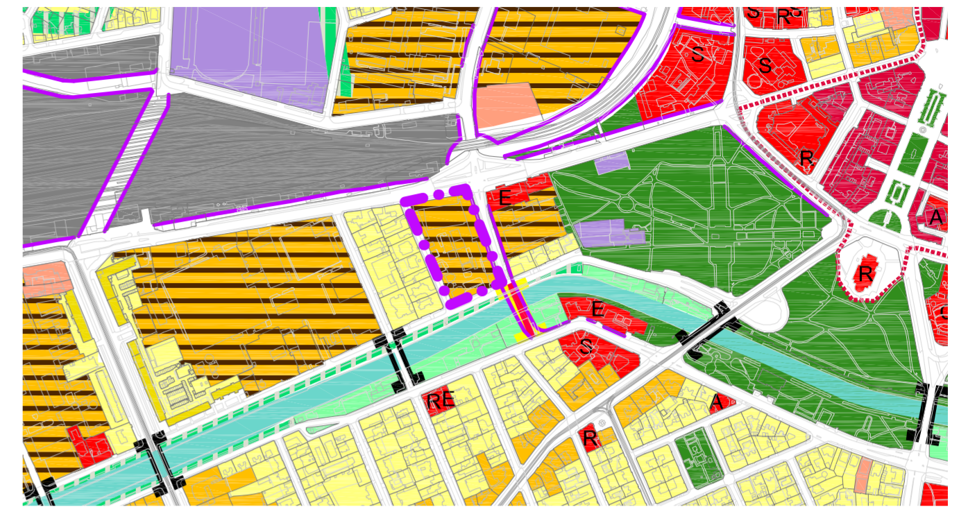
ZONIFICARE CONFORM PUG 2012