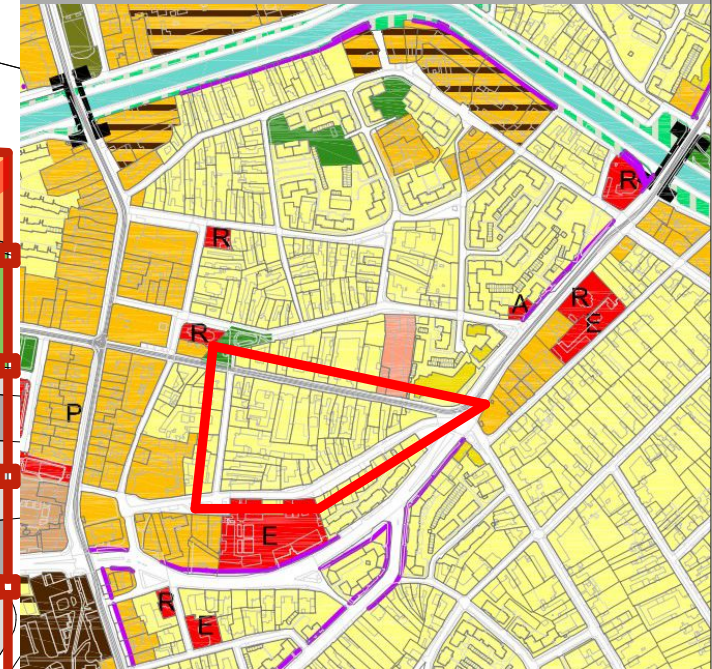
PLAN EXTRAS DIN NOUL P.U.G. / ETAPA3 / ZONIFICARE FUNCTIONALA

PUZ FUNCTIUNE MIXTA, pentru cladire S+P+4E+Er cu parcare subterana, parter comercial si asistenta sociala/camin asistenta batrani la nivelele 1,2,3,4 si Etr