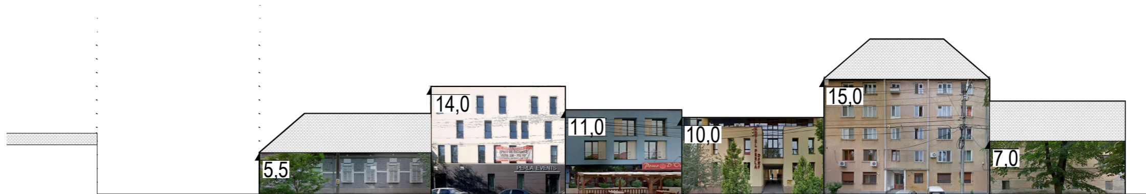
DESFASURATA STRADALA STR. EVLIA CELEBI