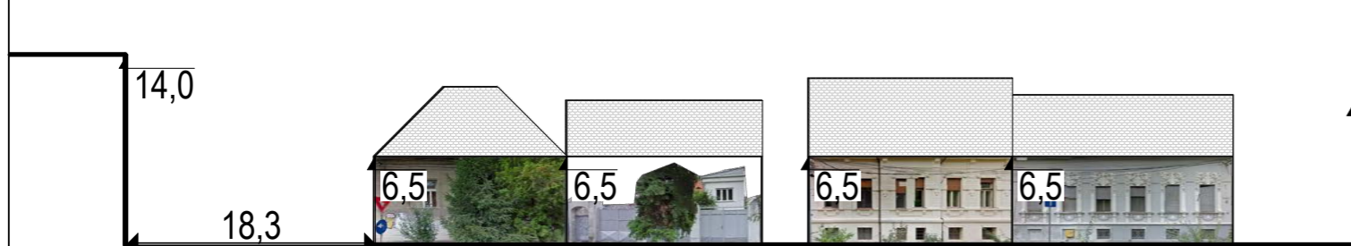
DESFASURATA PIATA BISERICII LATURA NORD