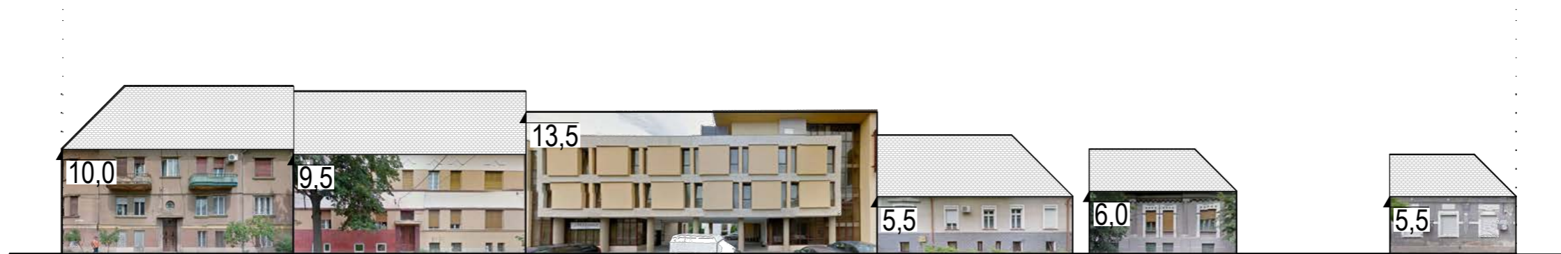
DESFASURATA STRADALA STR. GEORGE DRAGOMIR