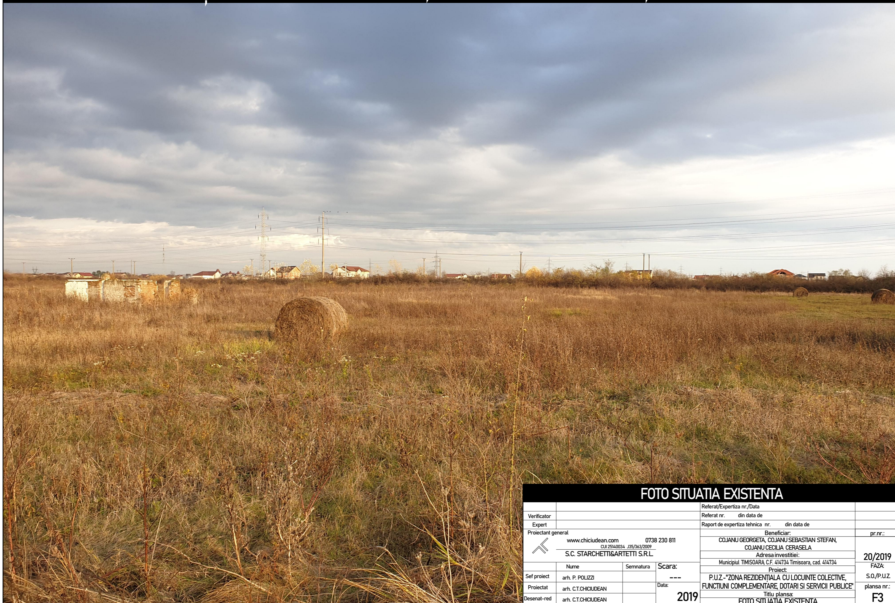
FOTO SITUATIA EXISTENTA