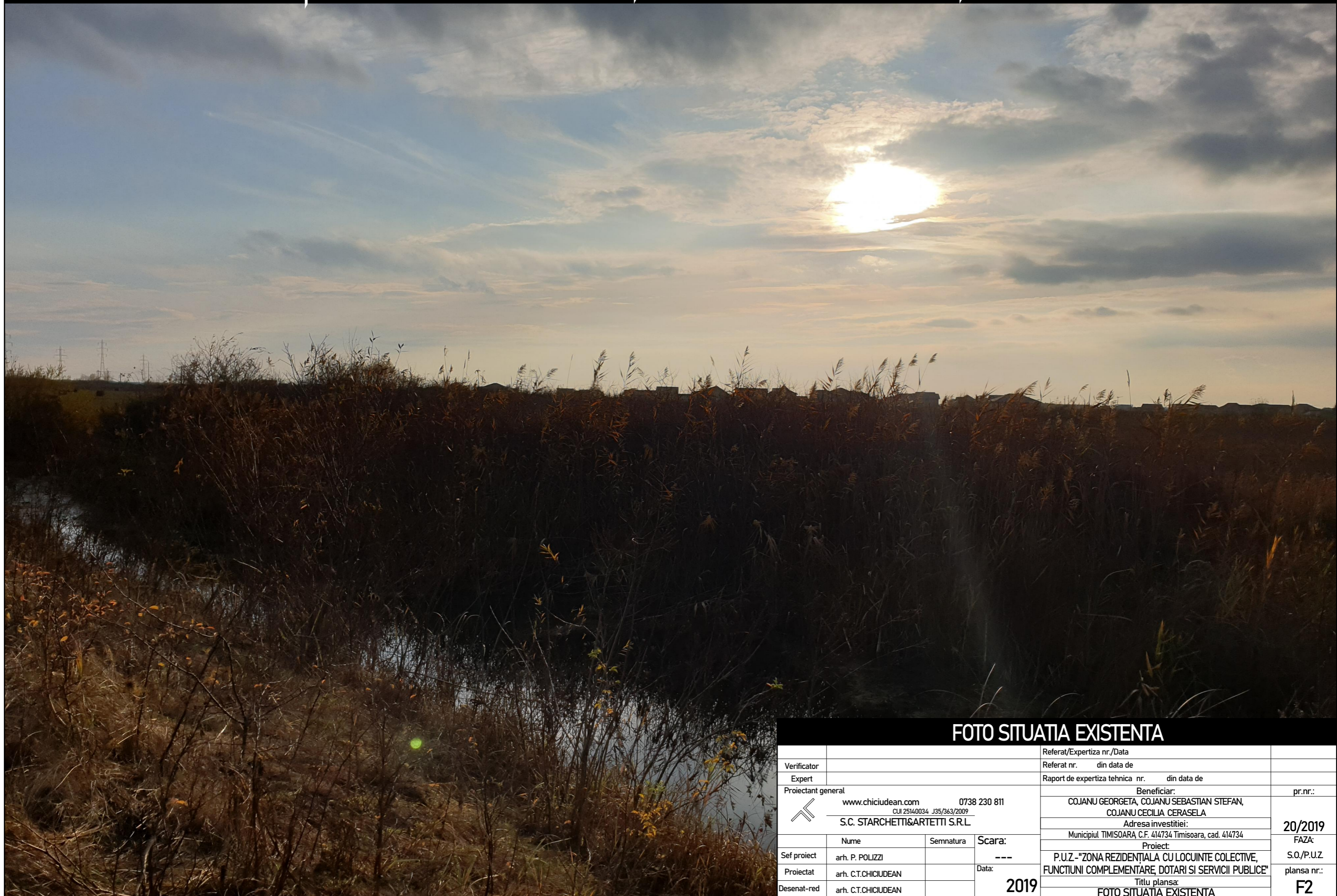
FOTO SITUATIA EXISTENTA