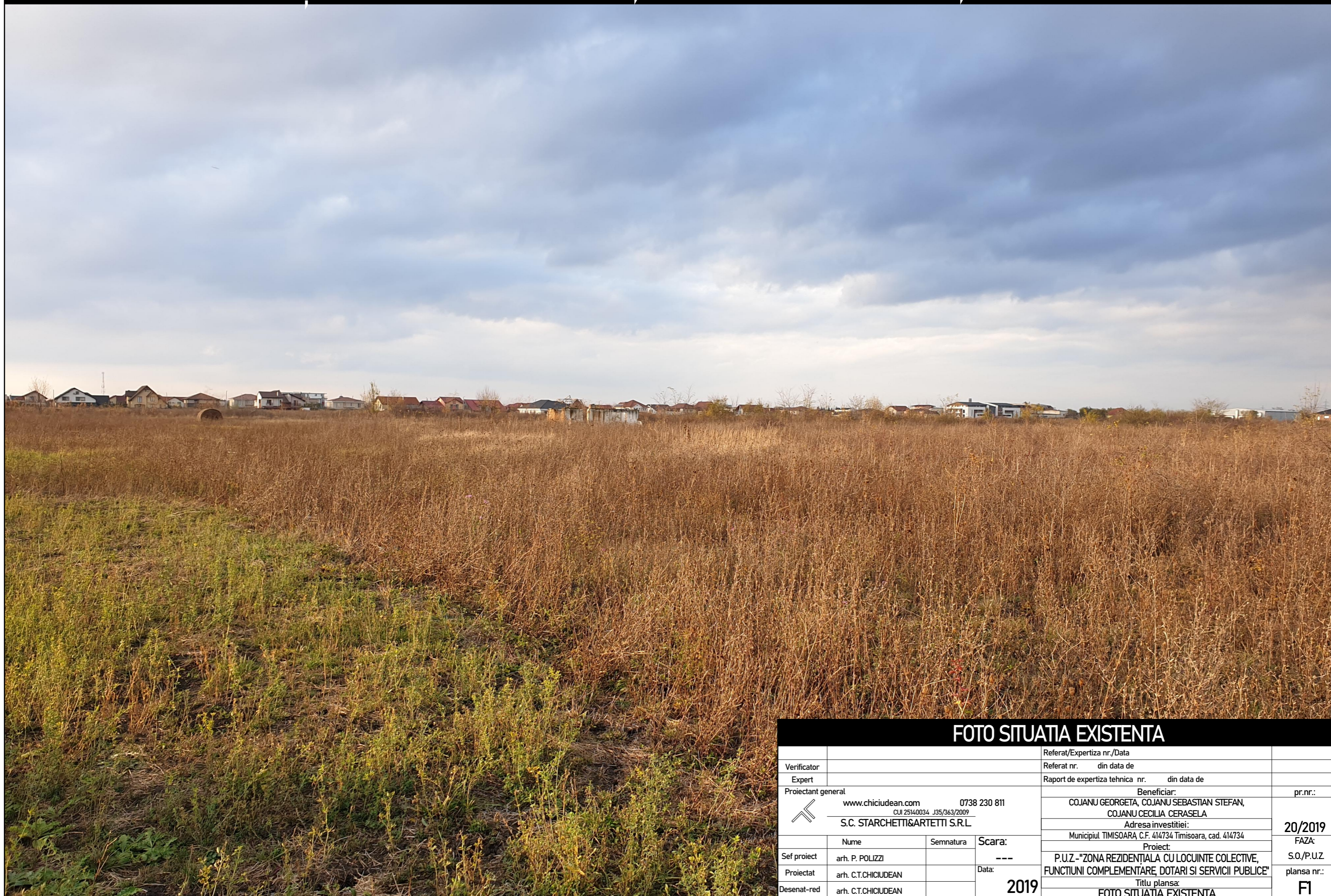
FOTO SITUATIA EXISTENTA