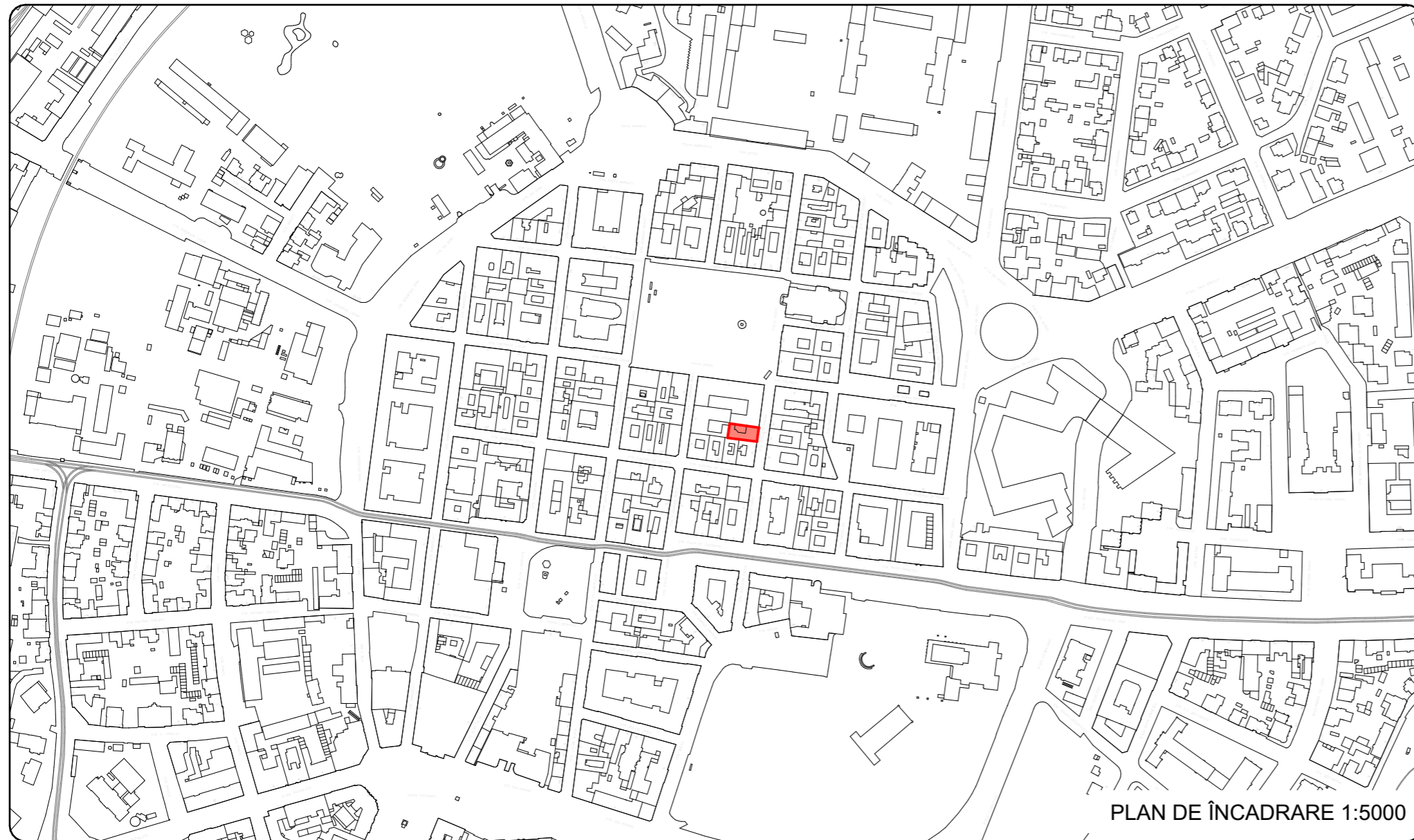
PLAN DE ÎNCADRARE 1:5000

PUZ - Mansardare pod existent rezultand imobil cu regim de inaltime D+P+1E+M, amplasare ascensor si platforma/ rampa acces persoane cu dizabilitati si inchidere curte interioara cu copertina - Imobilul bibliotecii Academiei Romane - Filiala Timis