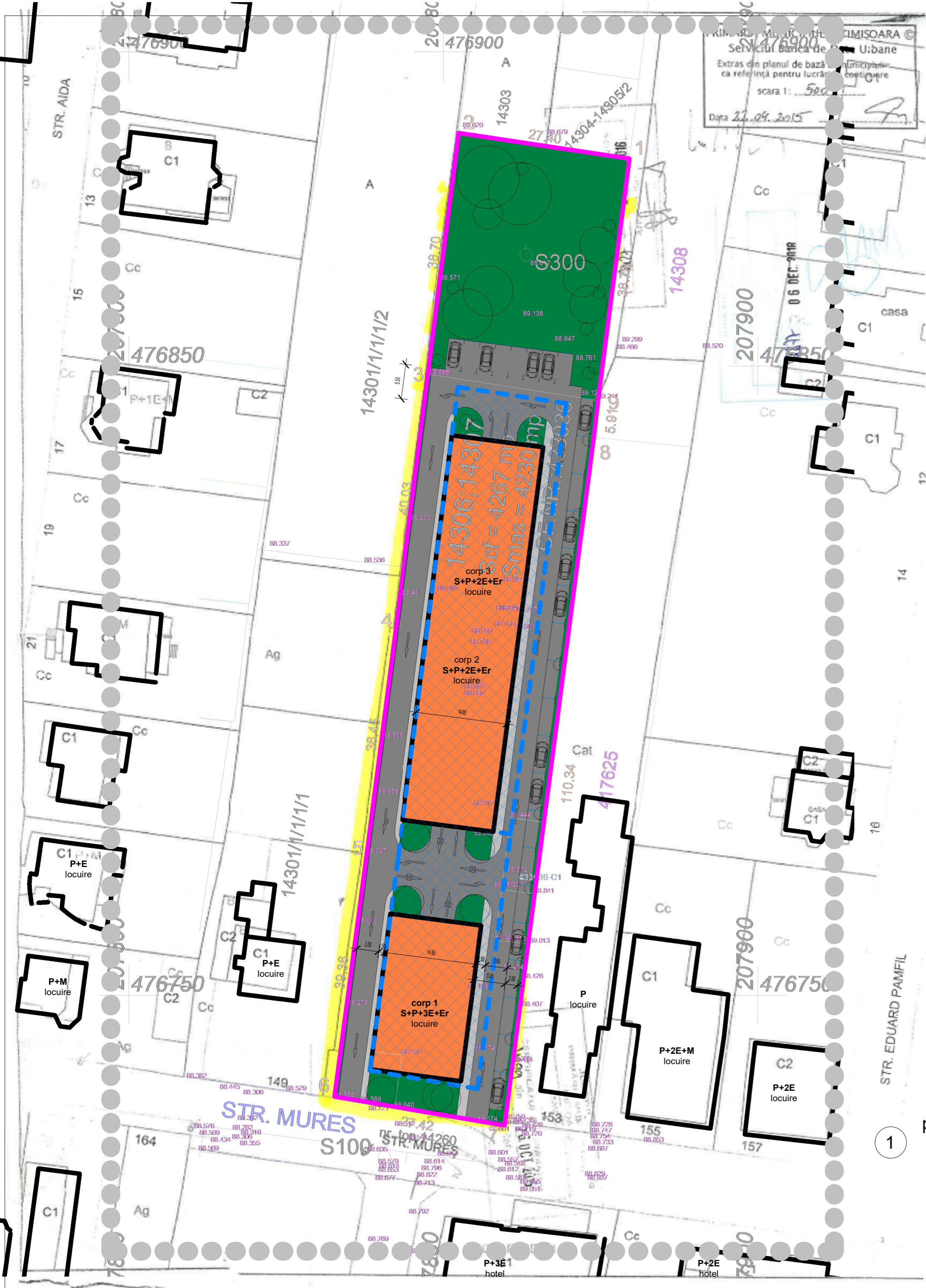
plan de incadrare zona propus