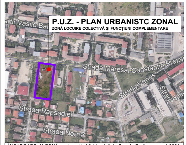
ÎNCADRARE ÎN ZONĂ - extras din hărțile digitale Google Earth - scara 1:5000

ZONĂ REZIDENȚIALĂ: LOCUIRE COLECTIVĂ ȘI FUNCȚIUNI COMPLEMENTARE