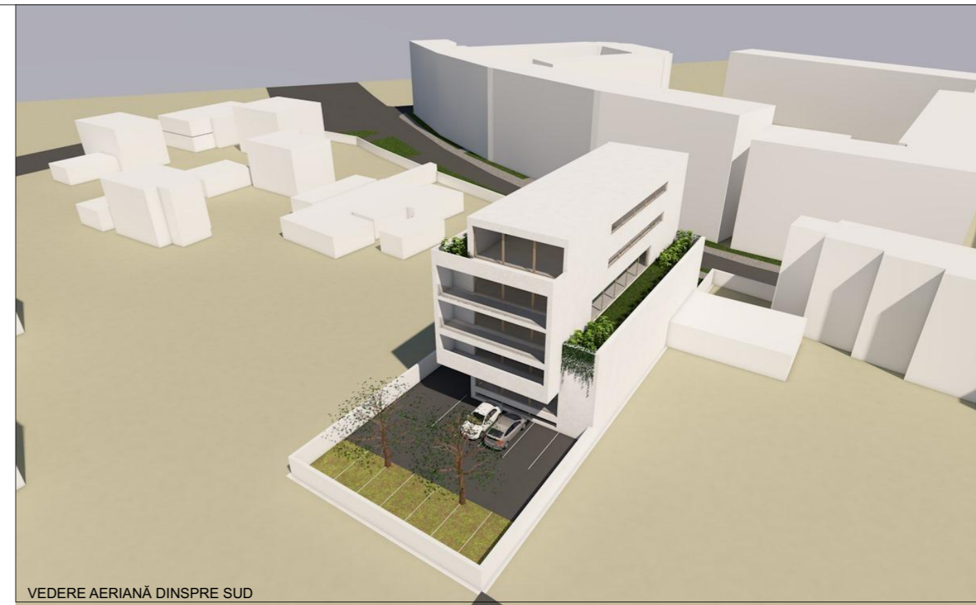
VEDERE AERIANĂ DINSPRE SUD