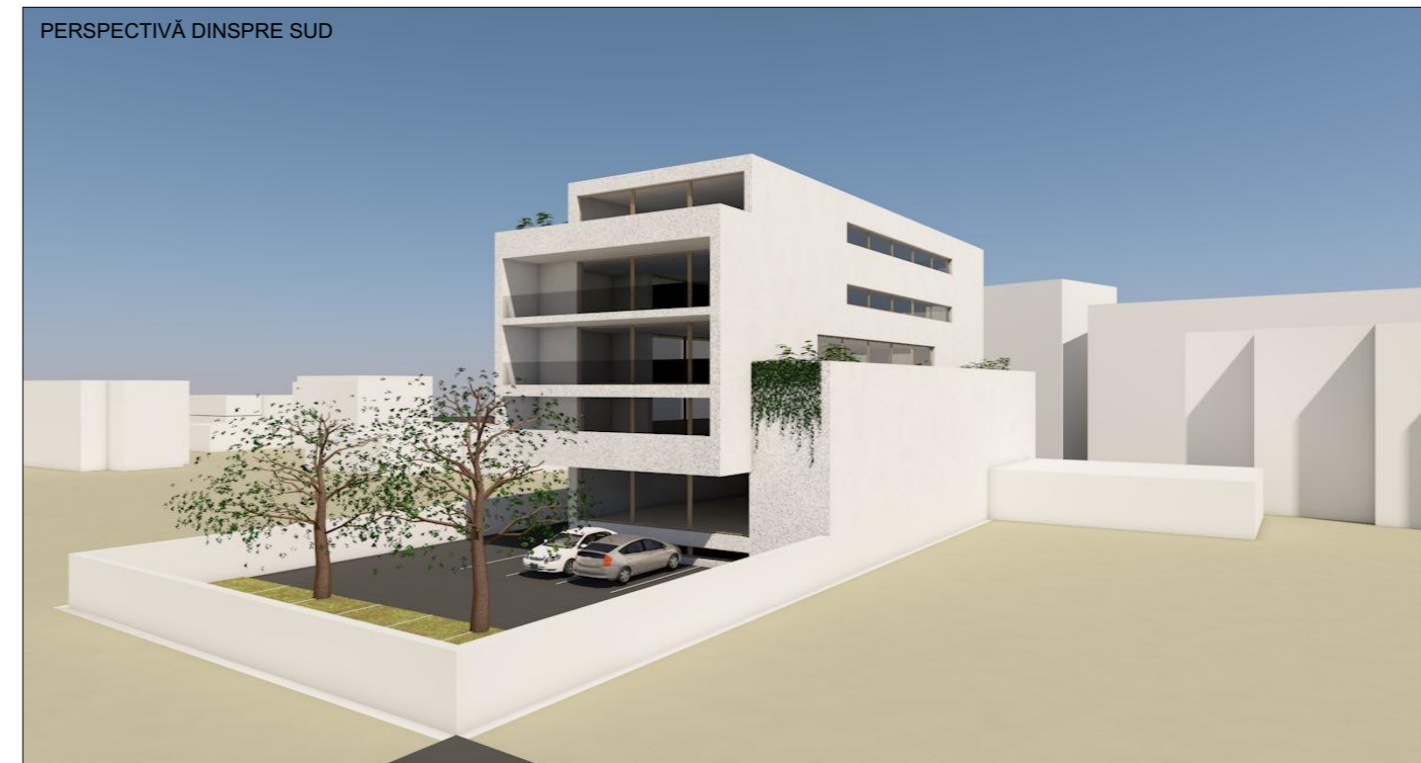
PERSPECTIVĂ DINSPRE SUD