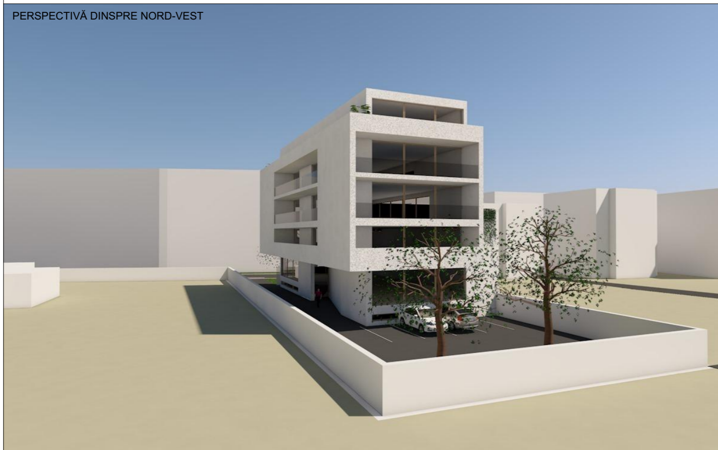
PERSPECTIVĂ DINSPRE NORD-VEST