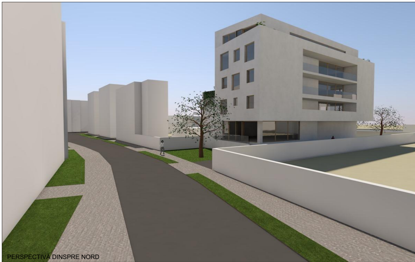
PERSPECTIVĂ DINSPRE NORD