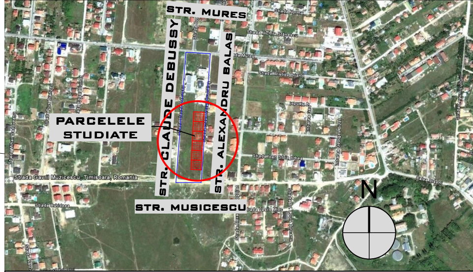
PLAN DE INCADRARE IN ZONA SCARA 1: 10.000