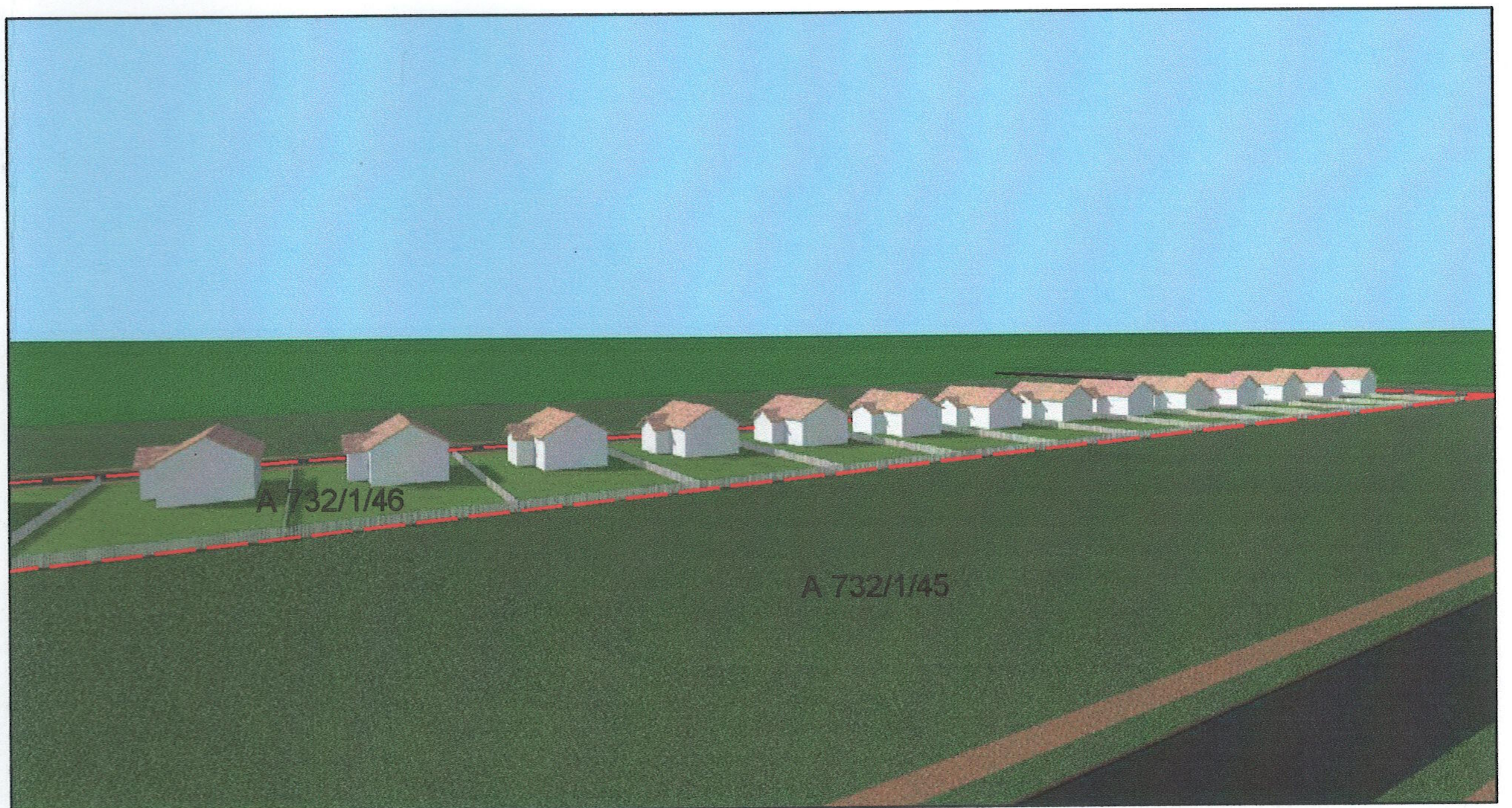
Vedere de ansamblu dinspre Est