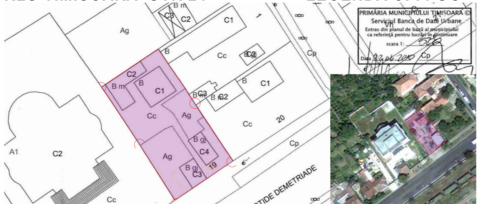
PLAN DE SITUATIE IN CONFORMITATE CU BAZA DE DATE P.M.T. FOTO AERIAN