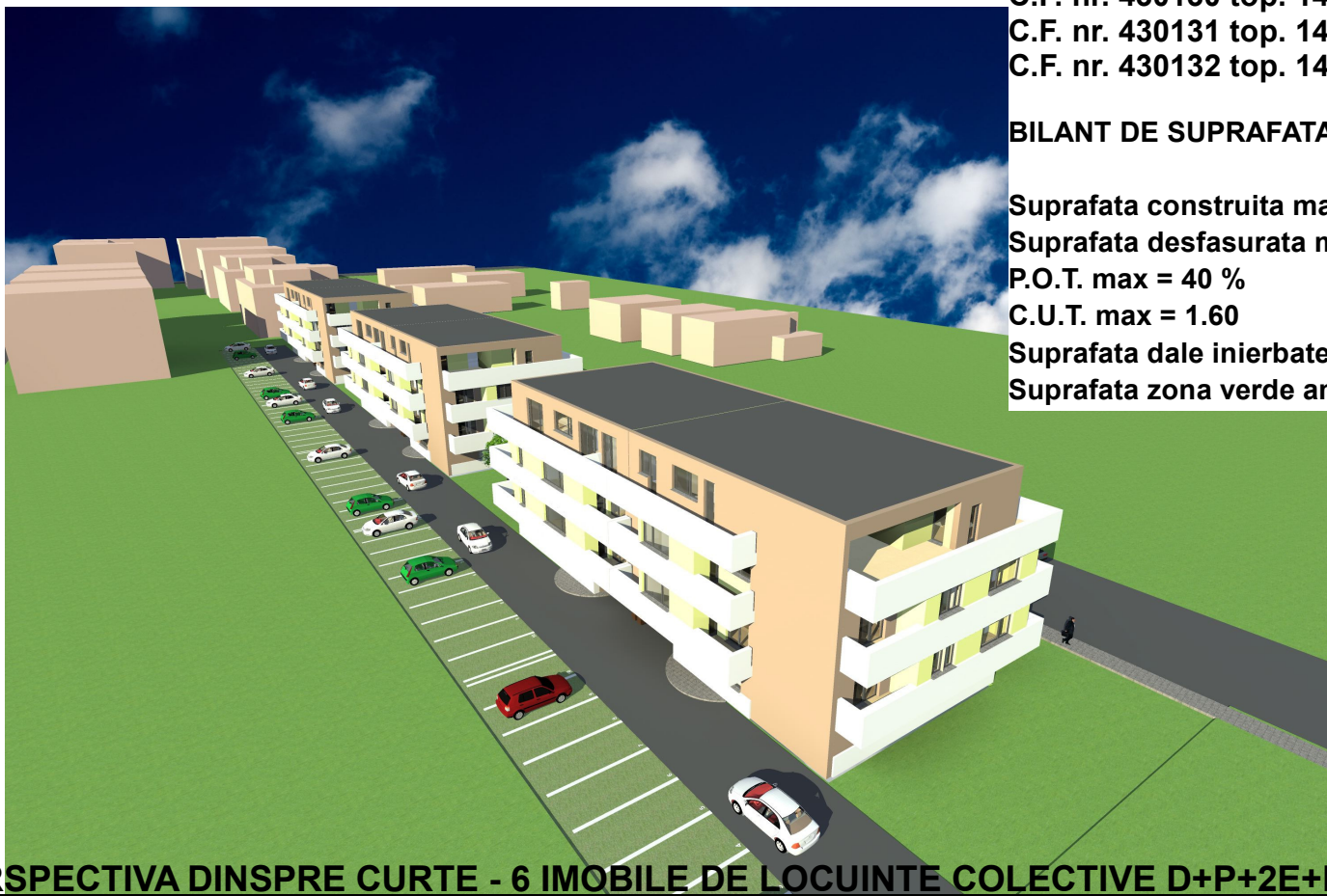
PERSPECTIVA DINSPRE CURTE - 6 IMOBILE DE LOCUINTE COLECTIVE D+P+2E+M/Eretras