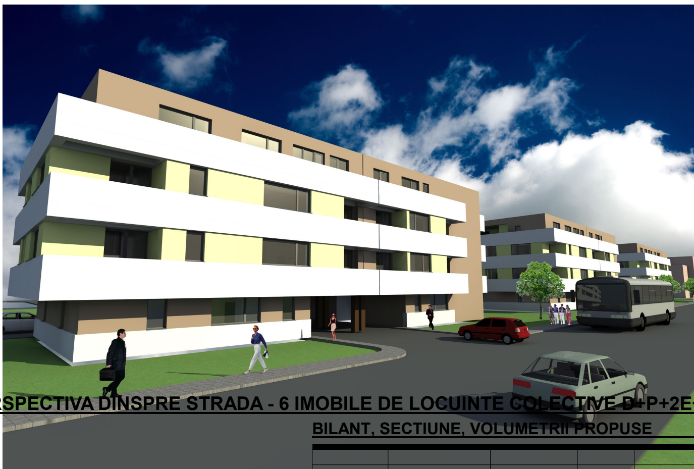
PERSPECTIVA DINSPRE STRADA - 6 IMOBILE DE LOCUINTE COLECTIVE D+P+2E+M/Eretras