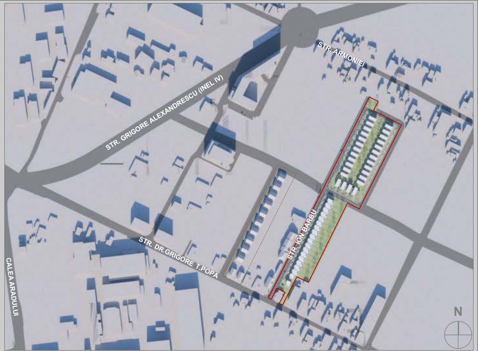
Incadrare in zona