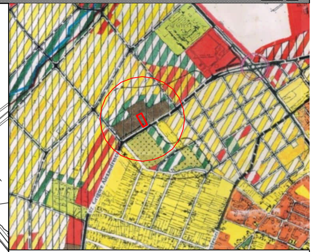
Incadrare in PUG