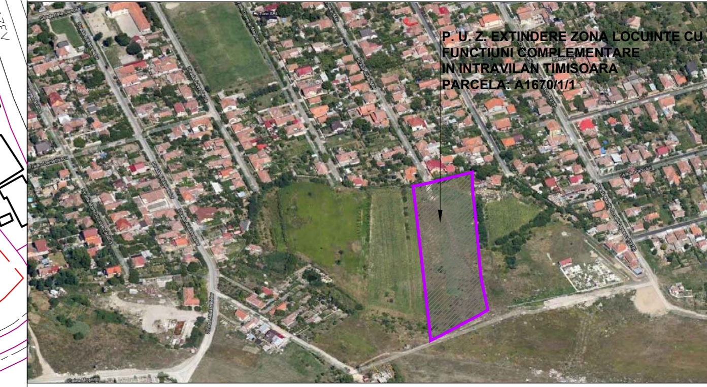
VEDERE AXONOMETRICA A AMPLASAMENTULUI