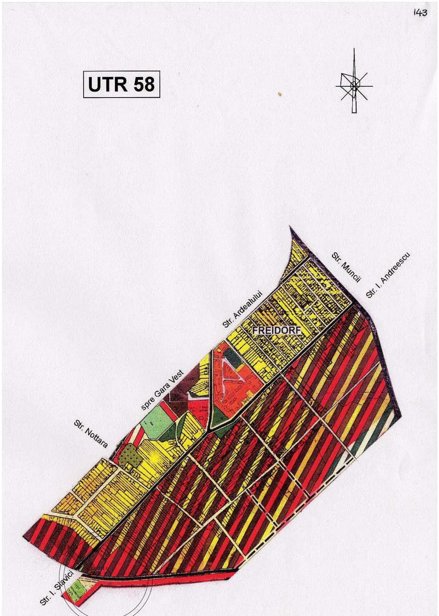
PLAN DE INCADRARE IN UTR 58