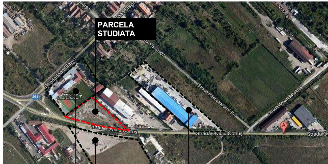
DOCUMENTATII APROBATE IN VECINATATE