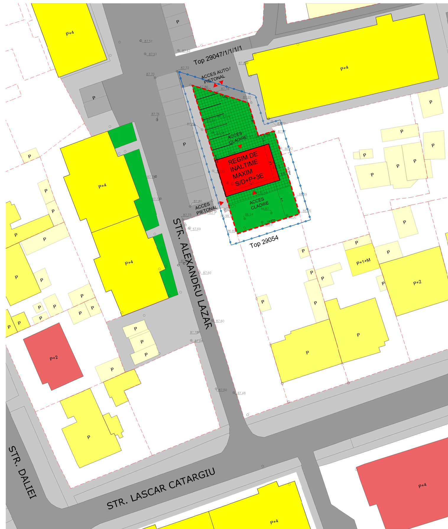
POSSIBILITATI DE MOBILARE URBANISTICA 1:500