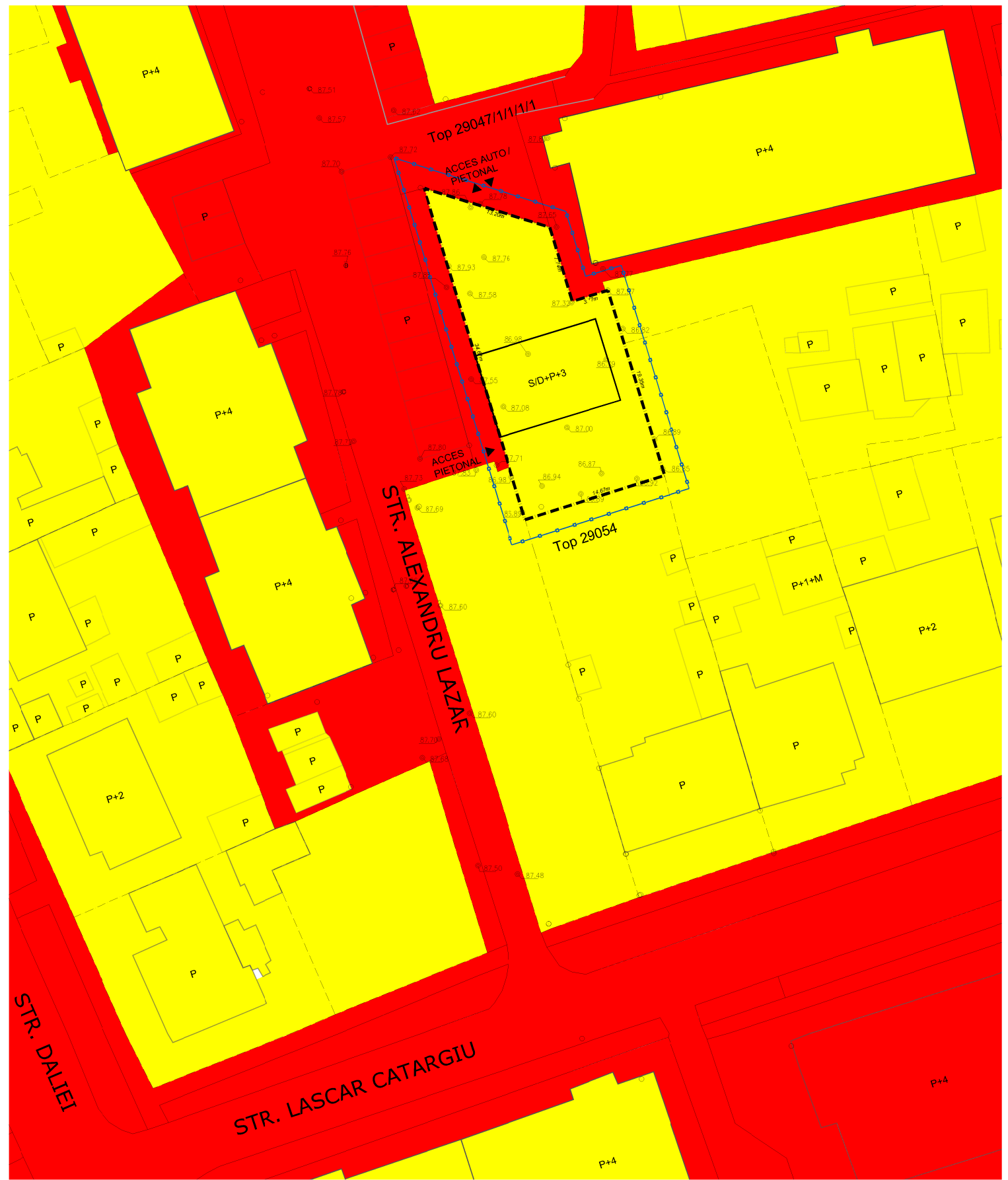
POSSIBILITATI DE MOBILARE URBANISTICA 1:500