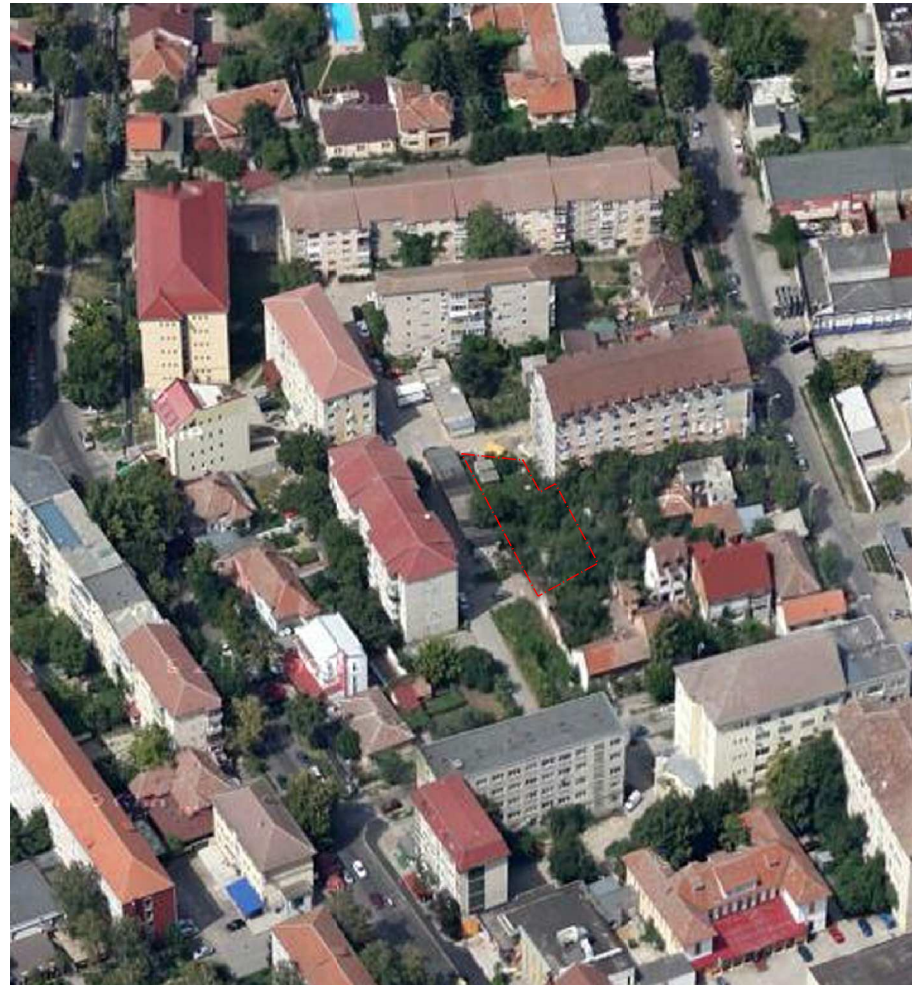
MACHETA VOLUMETRICĂ - SITUAȚIE EXISTENTĂ