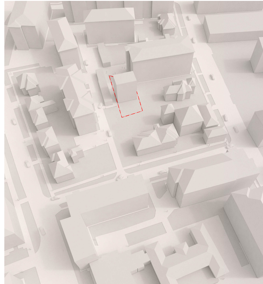
MACHETA VOLUMETRICĂ - SITUAȚIE PROPUȘĂ