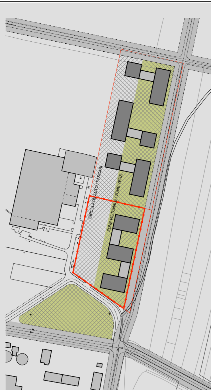
STUDIUL EVOLUTIEI VICINATĂRII sc. 1:3000