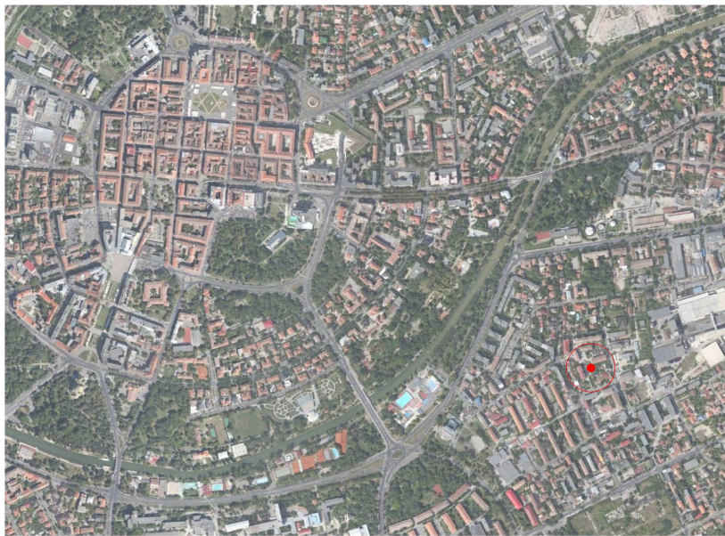
INCADRARE IN MUNICIPIUL TIMISOARA