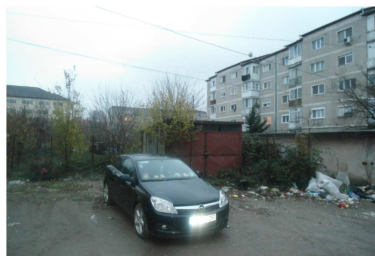
SITUATIE EXISTENTA - VEDERI DINSPRE NORD