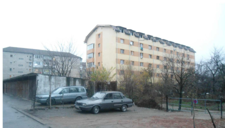
VEDERE DIN STRADA ALEXANDRU LAZAR