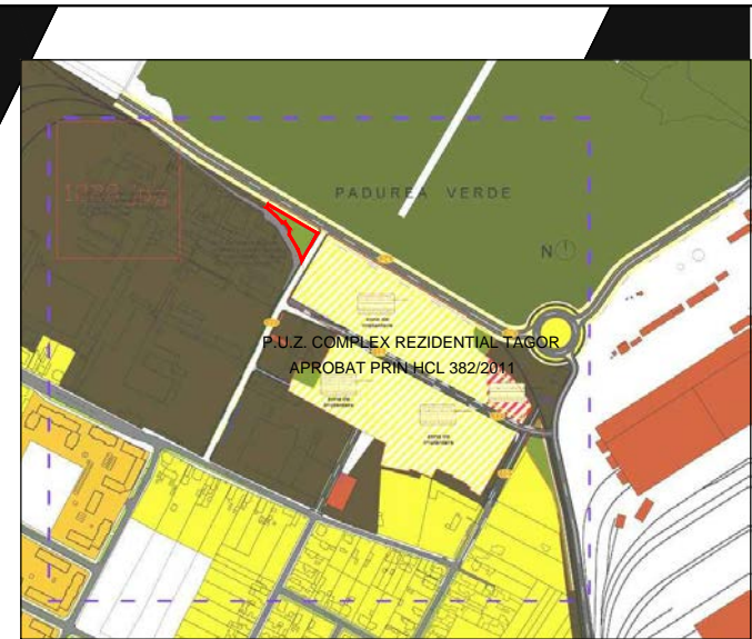
INCADRARE IN ZONA, sc. 1:10.000