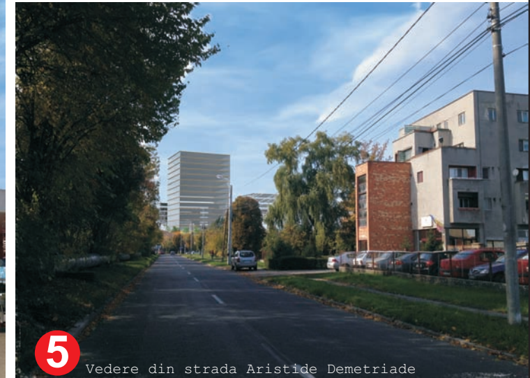
5 Vedere din strada Aristide Demetriade