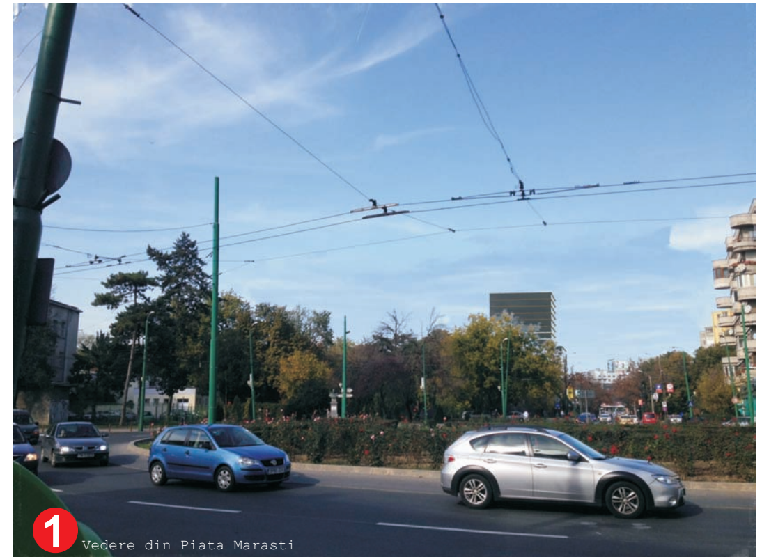
1 Vedere din Piata Marasti