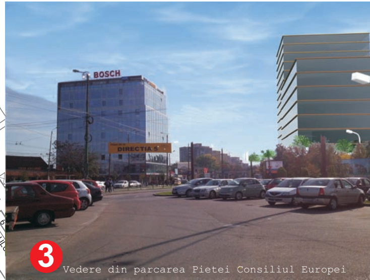
3 Vedere din parcare Pieta Consiliul Europei