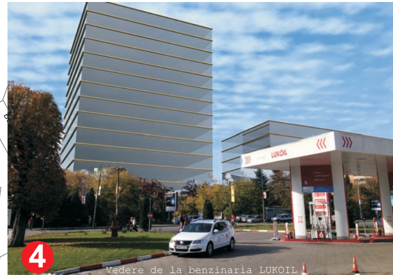
4 Vedere de la benzinaria LUKOIL