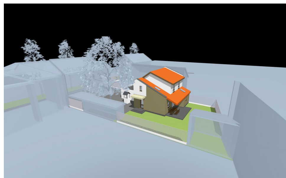
vedere de ansamblu cu propunerea poziționării noii clădiri