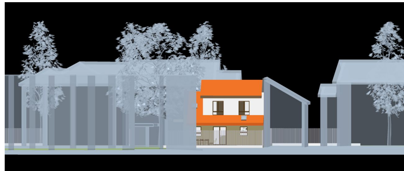
vedere B , fațadă sud