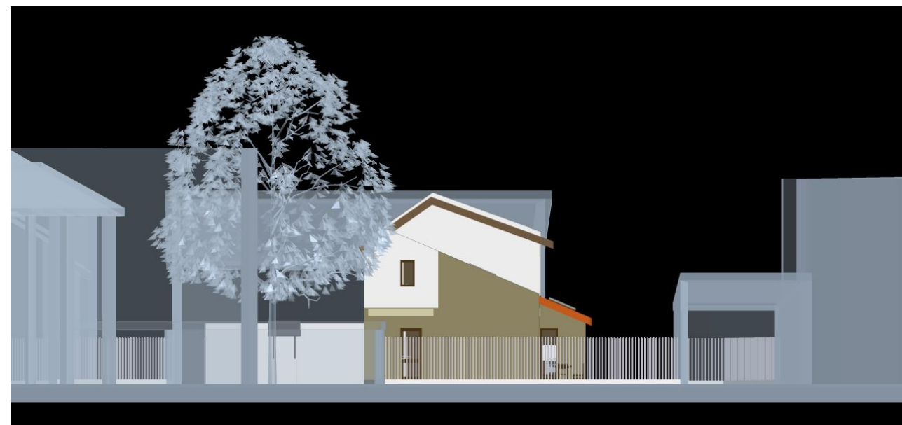
vedere C , fațadă laterală vest