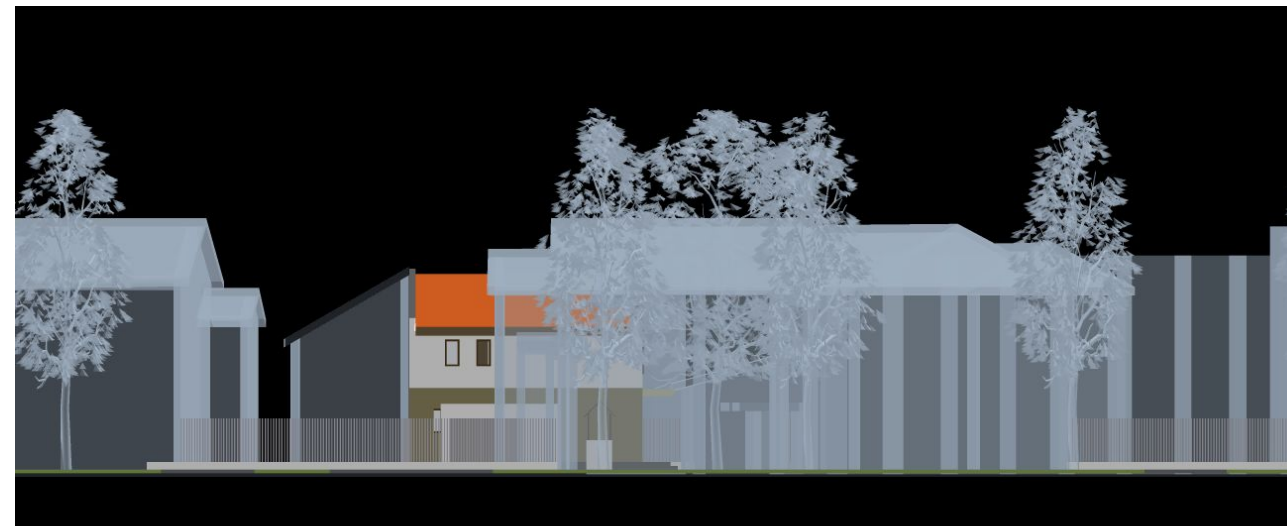
vedere A de pe strada Rusu Șireanu