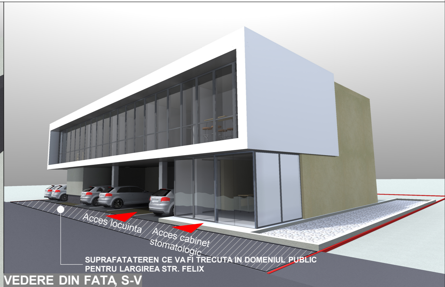
VEDERE DIN FATA, S-V