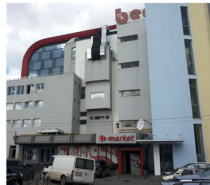
Fatada spre Parcul Civic