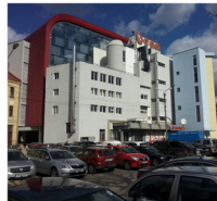
Fatada spre Parcul Civic