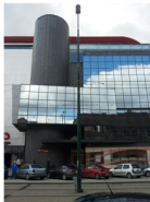
Fatada strada Proclamatia de la Timisoara