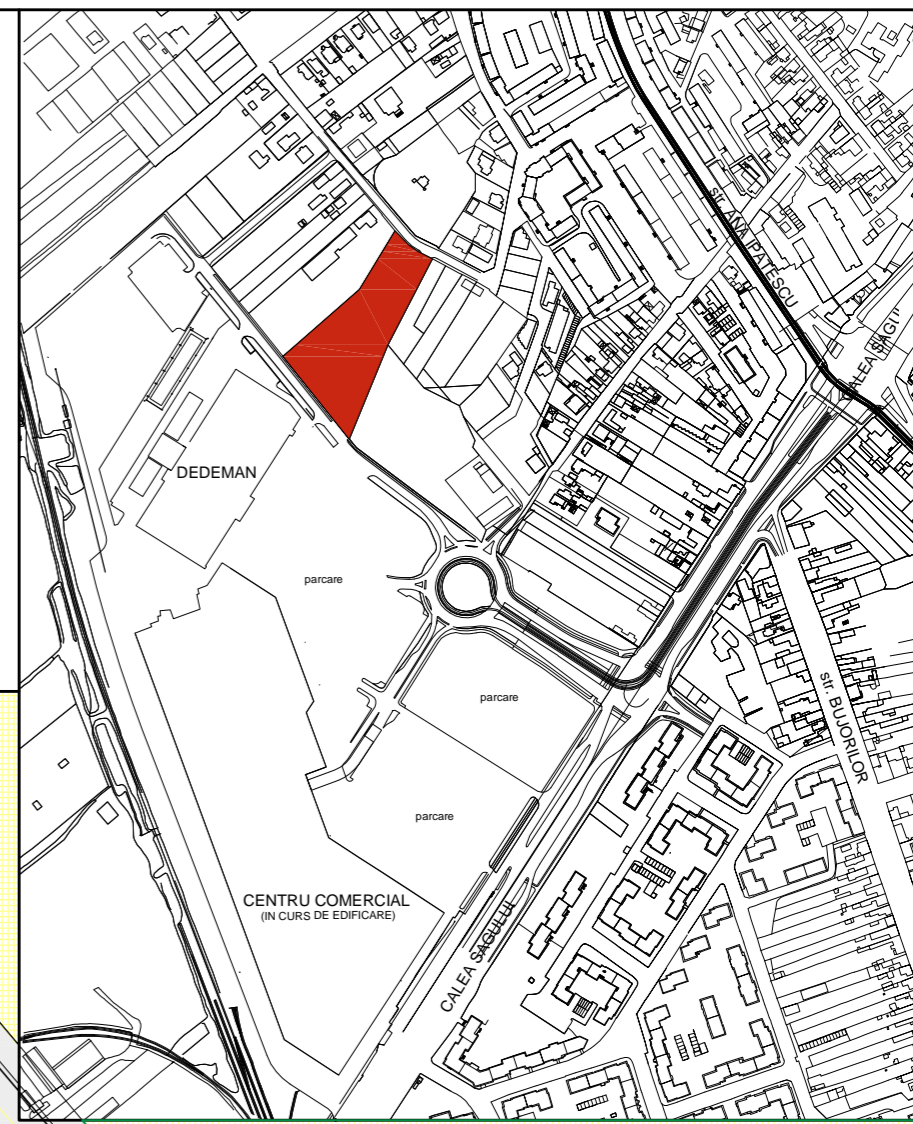
PLAN DE INCADRARE scara grafica