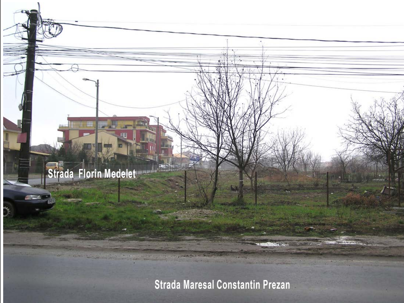
Strada Florin Medeleț