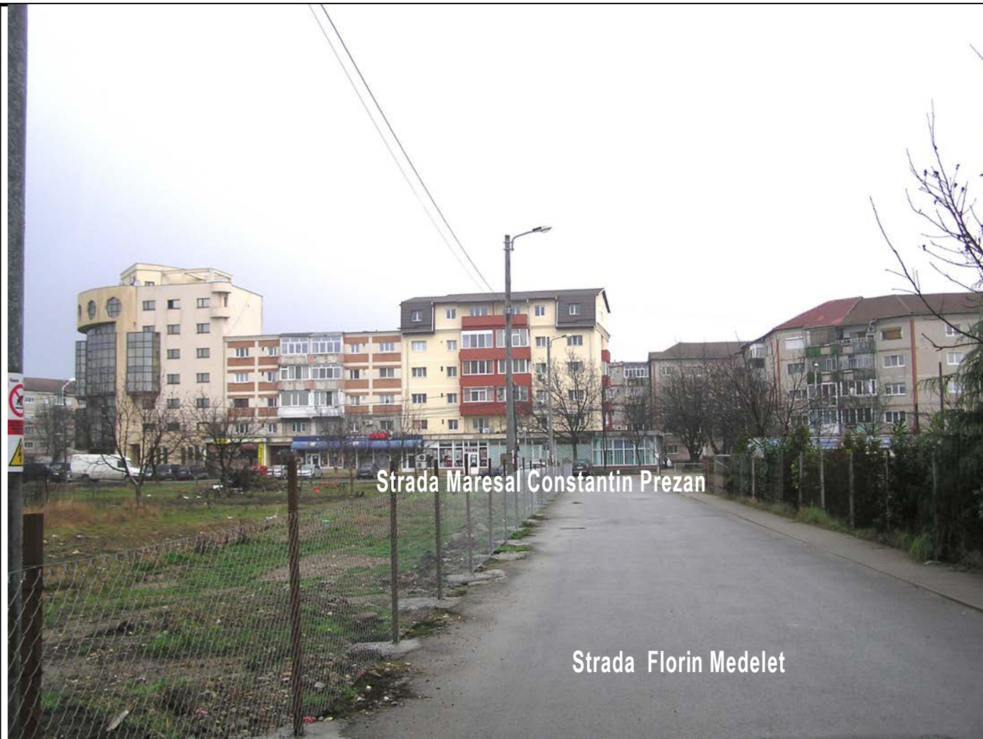
Strada Maresal Constantin Prezan