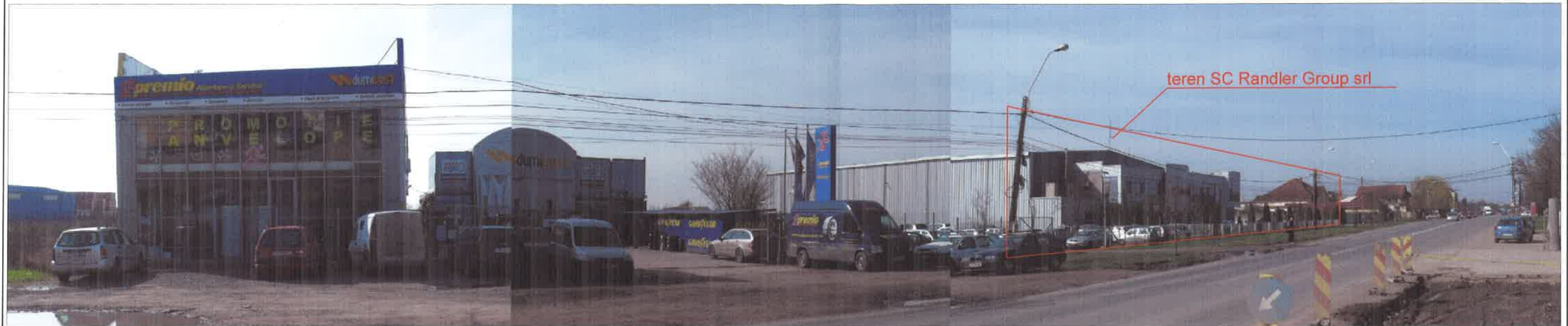
Calea Buziasului nr. 120-140