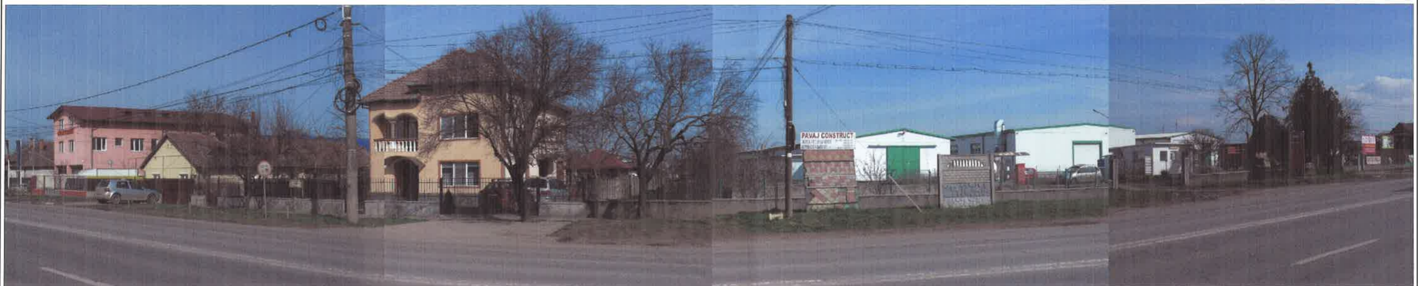
Calea Buziasului nr. 65-91