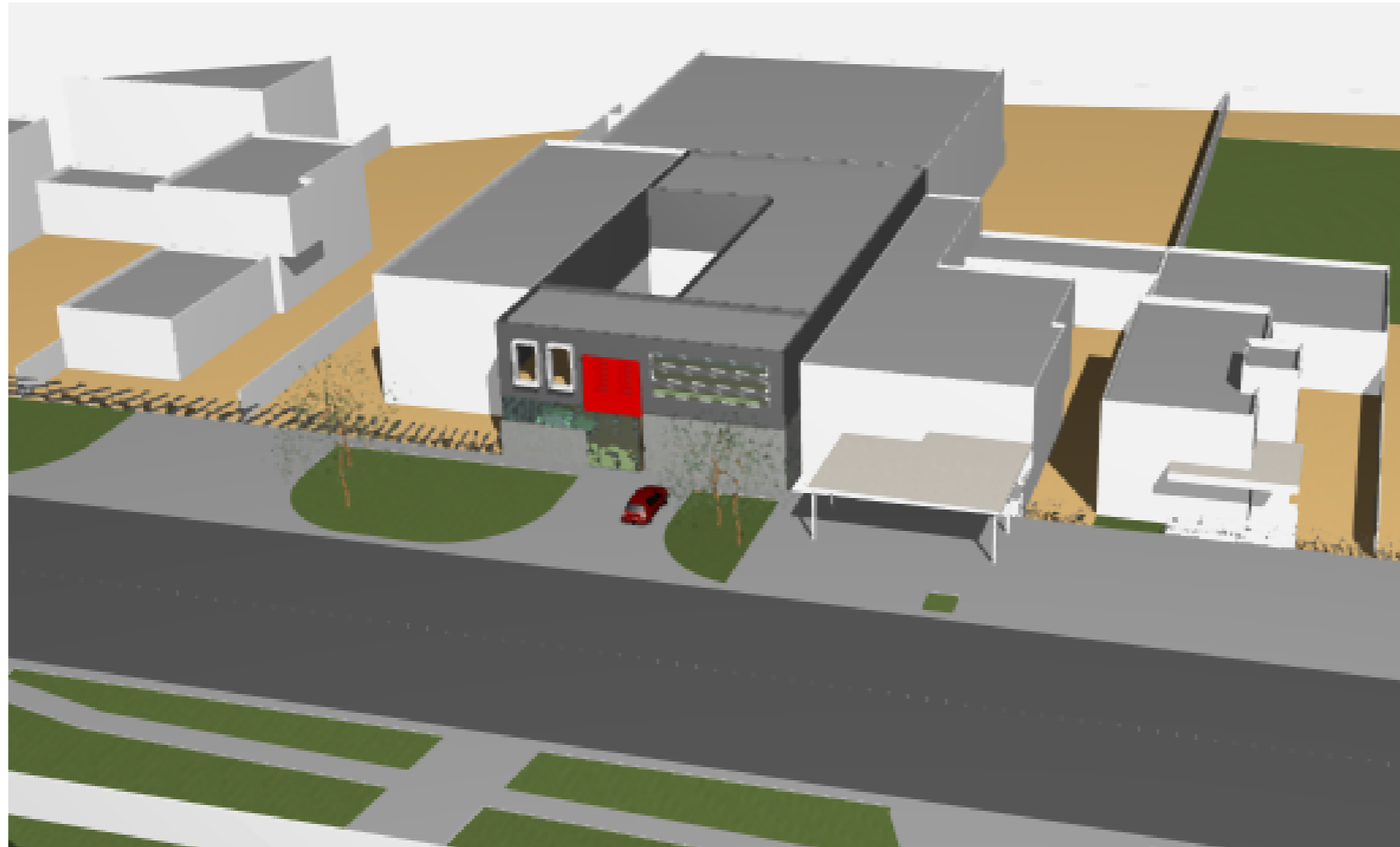
P.U.D. "EXTINDERE, ETAJARE ȘI SCHIMBARE DESTINAȚIE CASA DE LOCUIT P, REZULTÂND BAR ȘI SERVICE AUTO ÎN REGIM P+1E, CU ÎNCADRARE ÎN FUNCȚIUNEA ZONEI DE DEPOZITARE ȘI PRESTARI SERVICII, CONF. PUG TIMIȘOARA, CALEA ȘAGULUI, NR.173, TIMIȘOARA" VOLUMETRIE - PERSPECTIVE