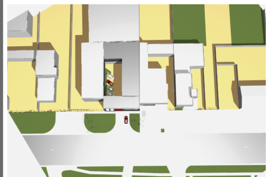
VEDERE AERIANĂ AMPLASAMENT