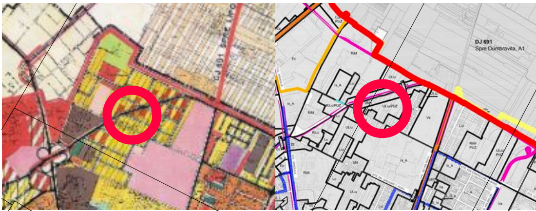
INCADRARE IN P.U.G.