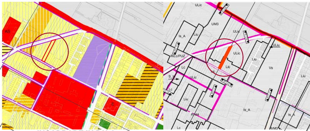
INCADRARE IN P.U.G.