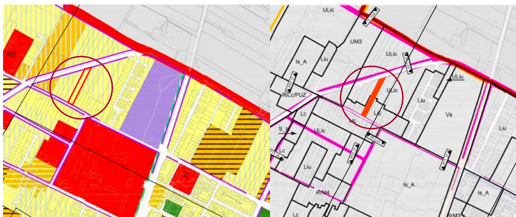
INCADRARE IN P.U.G.