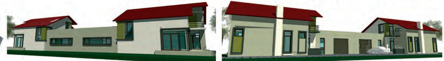
TIPOLOGIE CASA P+M / GARAJ P