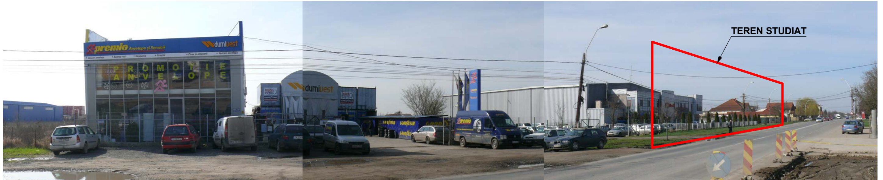
CALEA BUZIAȘULUI NR. 120-128