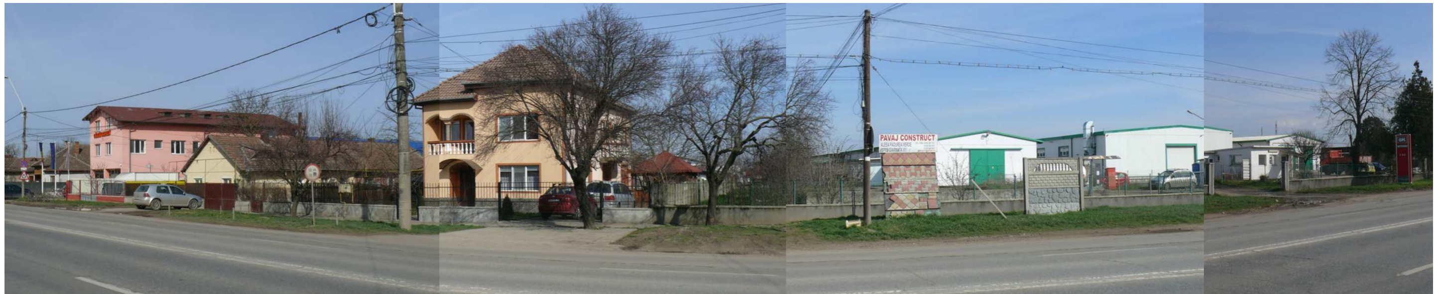
CALEA BUZIAȘULUI NR. 65-91