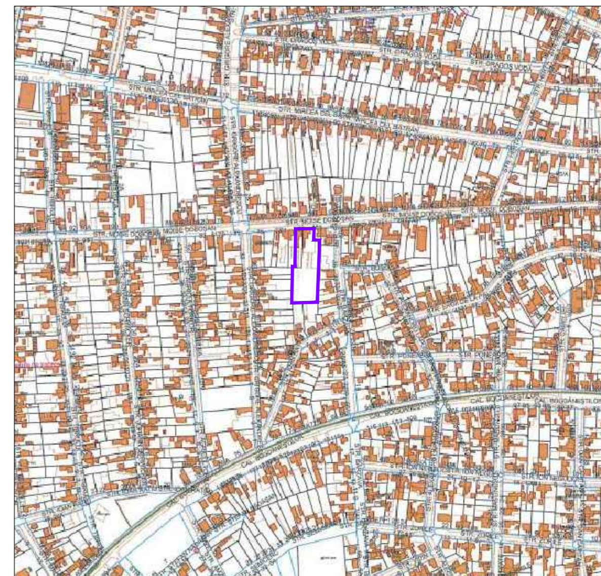
— LIMITA PROPRIETATE / ZONA STUDIATA