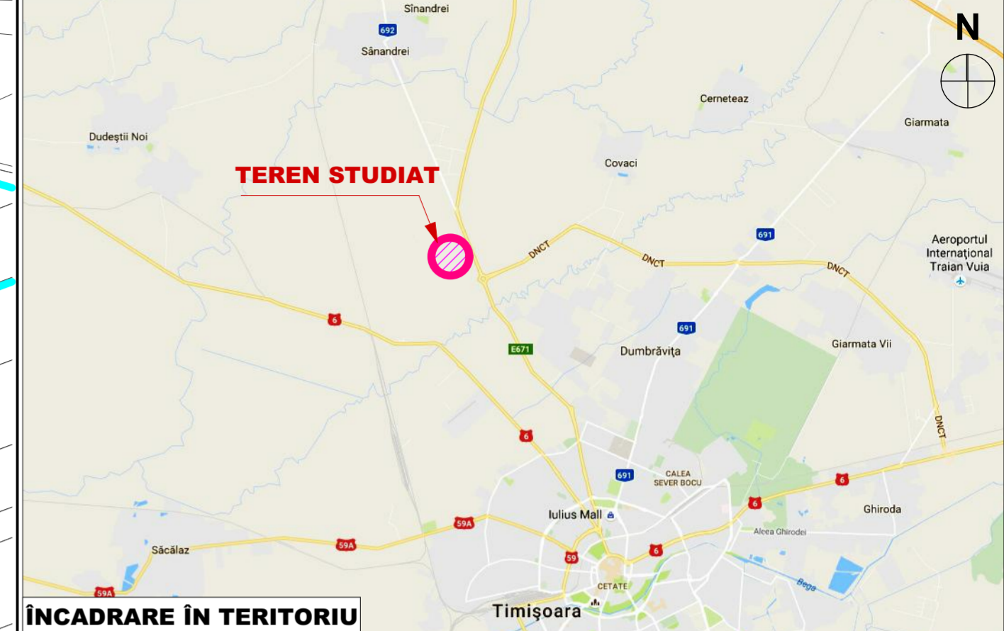
ÎNCADRARE ÎN TERITORIU