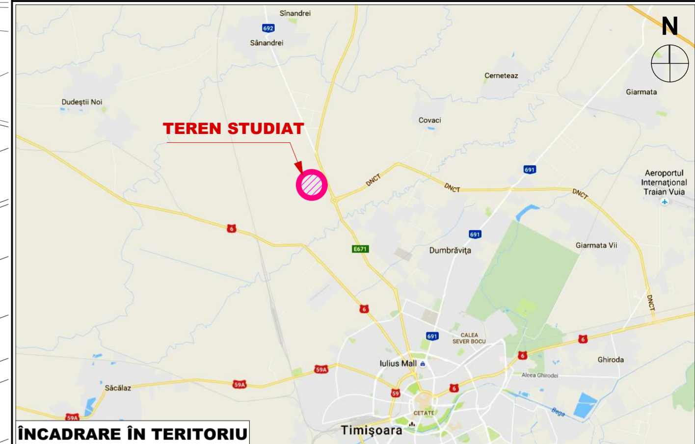
ÎNCADRARE ÎN TERITORIU