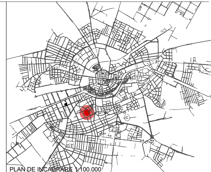
PLAN DE INCADRARE 1:100.000

Ca baza grafica s-a utilizat un EXTRAS din PUZ ZONA ODOBESCU, TIMISOARA - PLANSA DE REGLEMENTARI aprobat prin HCL 96/1998, preluat de PUG