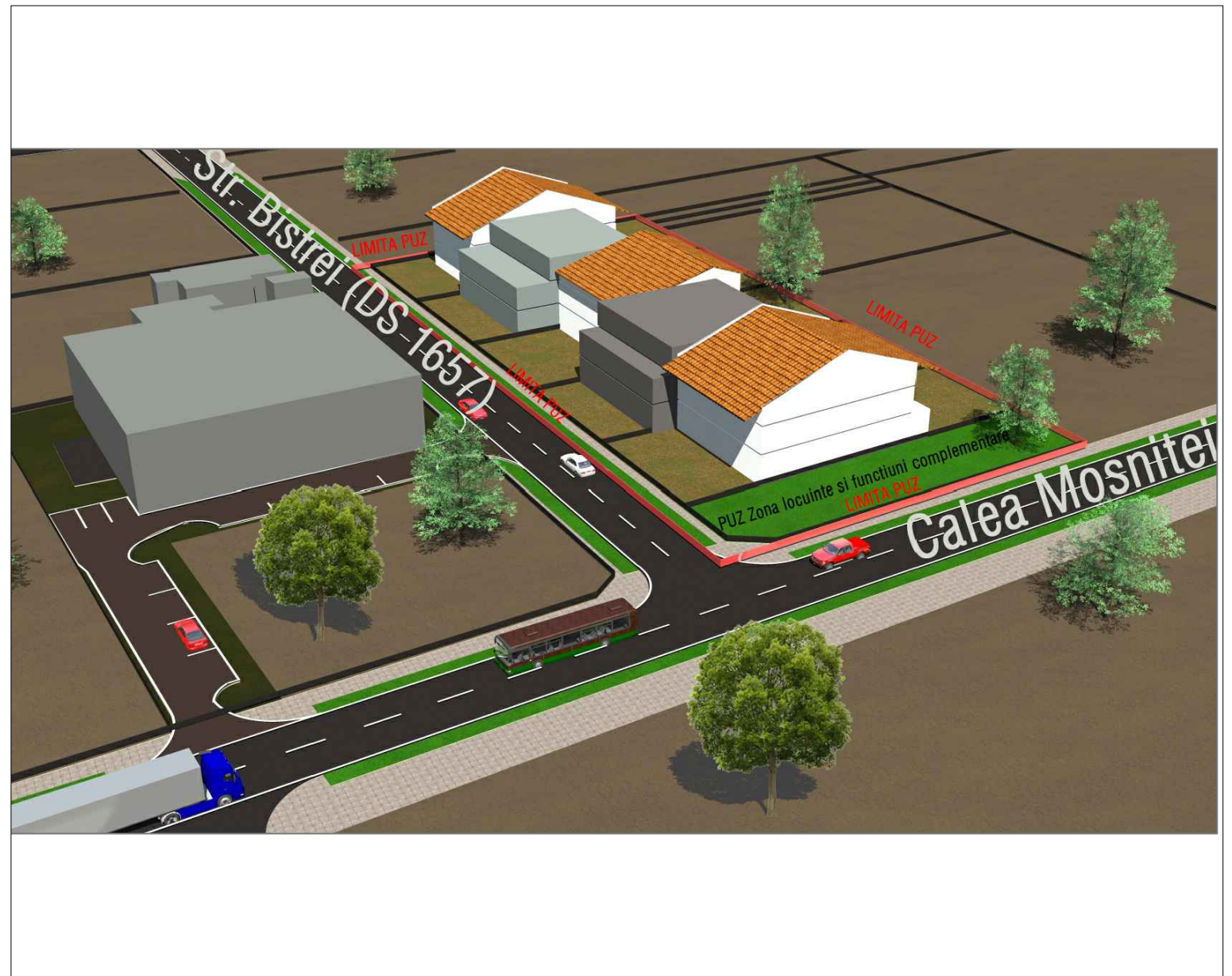
contur tarla / PUZ in curs de realizare