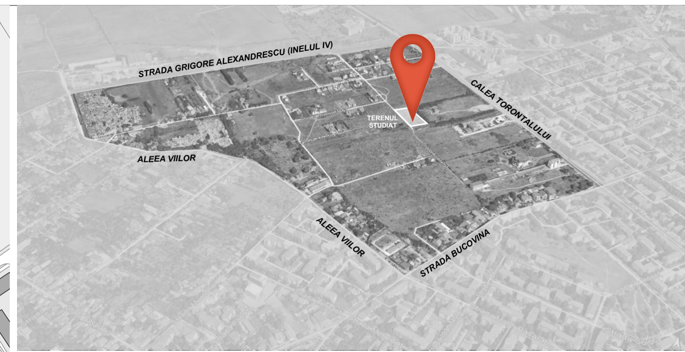
PERSPECTIVA CVARTAL STUDIAT