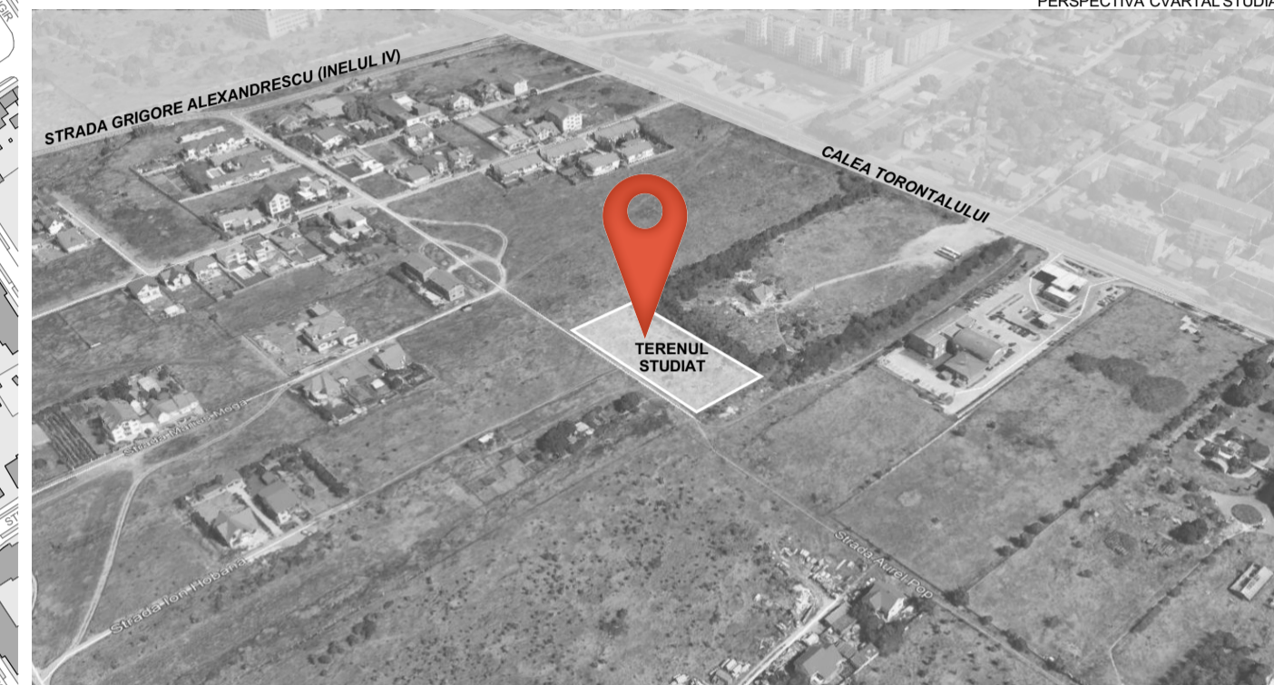
POZITIONAREA TERENULUI STUDIAT IN CADRUL CVARTALULUI