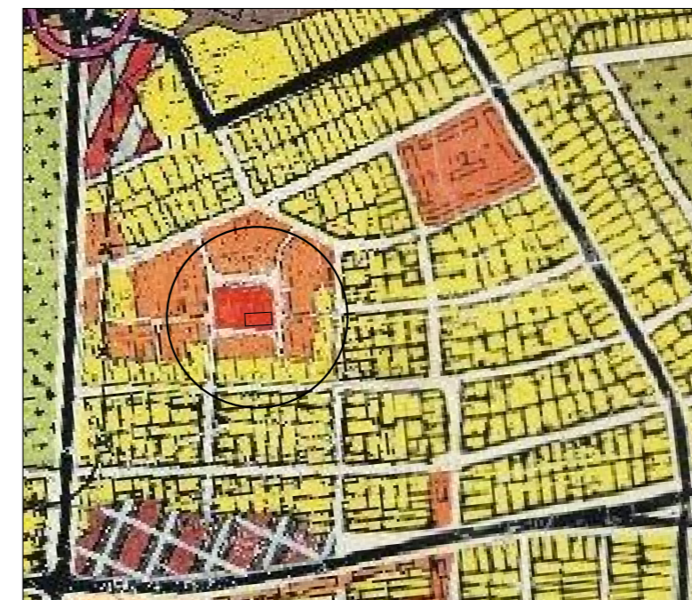
Extras din PUG apobat prin HCL 157/2002 prelungit prin HCL 139/2007, HCL 105/2012, HCL 107/2014, HCL 131/2017