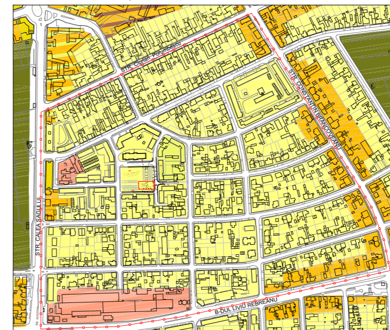
Extras din PUG-ul nou (conform Regulamentului Local aferent "Propunerilor preliminare ce vor fi supuse spre avizare- Etapa a 3-a elaborare PUG Timisoara" aprobate prin HCL nr. 428/2013)