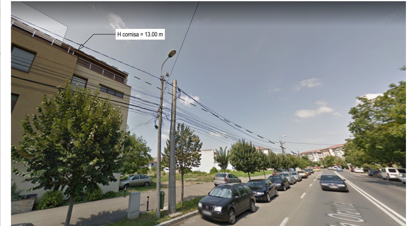
PERSPECTIVA STR. ORAVITA. SITUATIE EXISTENTA EXTRAS REGLEMENTARI PUZ ION I. DE LA BRAD APROBAT PRIN HCL 186/2003

CONFORM CERTIFICAT DE URBANISM NR. 4099 / 21.09.2017 IN SCOPUL: CONSTRUIRE IMOBIL LOCUINTE COLECTIVE P+4 CU SPATII COMERCIALE LA PARTER