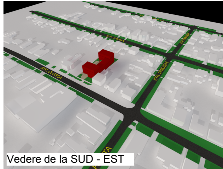
Vedere de la SUD - EST