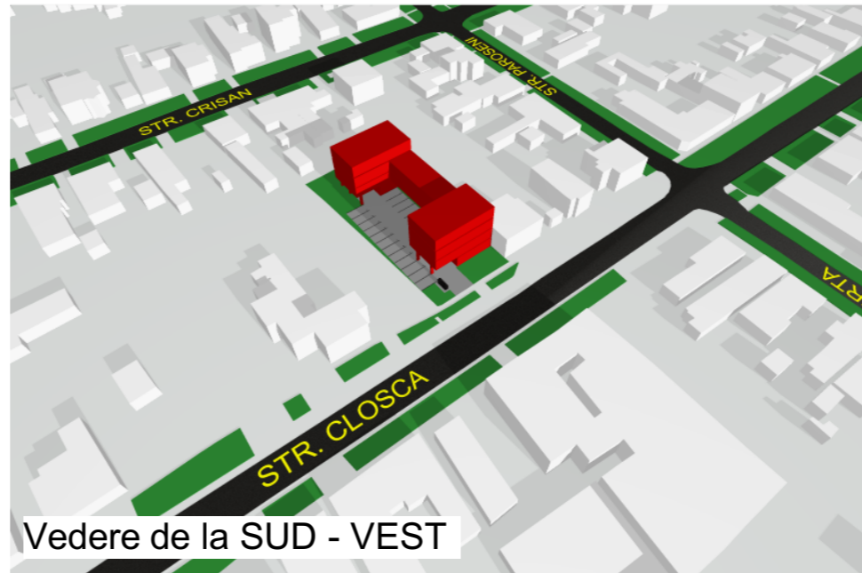
Vedere de la SUD - VEST