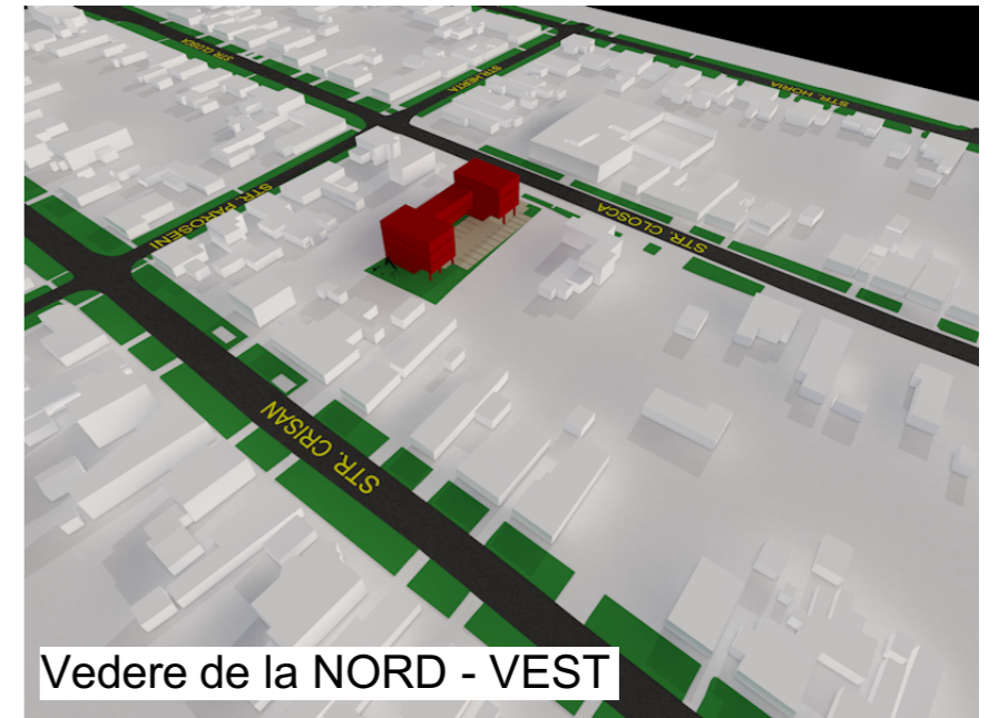
Vedere de la NORD - VEST