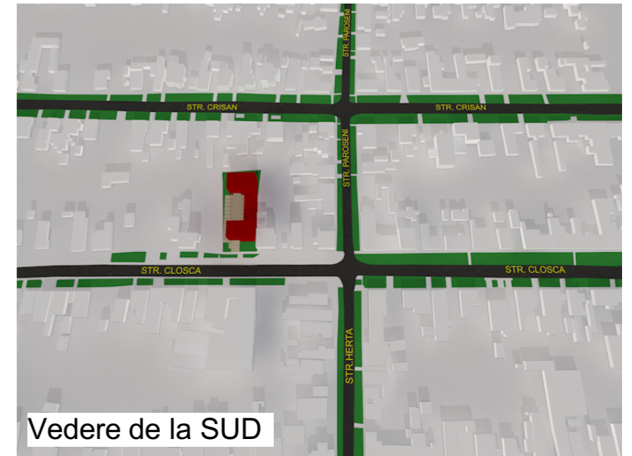
Vedere de la SUD