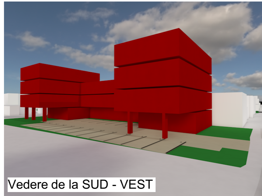
Vedere de la SUD - VEST