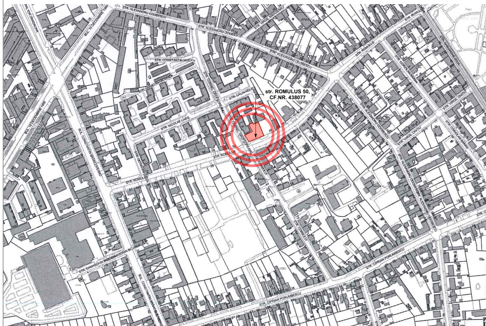
PLAN INCADRARE IN ZONA - PMT SC. 1 : 5000