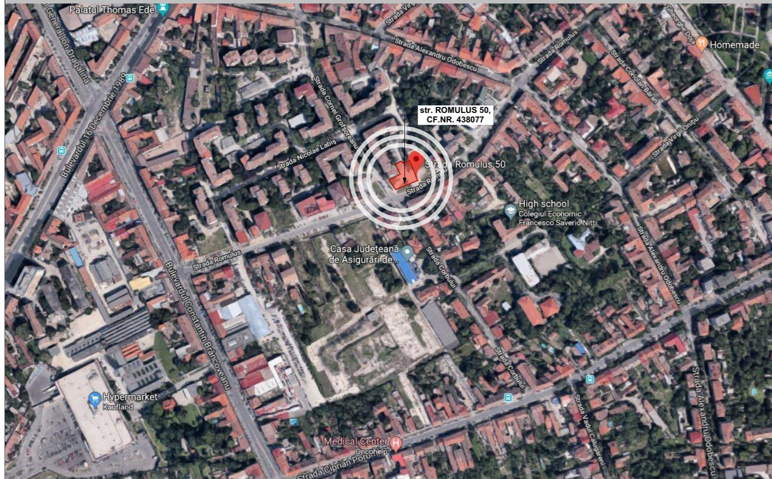
PLAN DE INCADRARE - GOOGLE MAPS SC. 1 : 5000