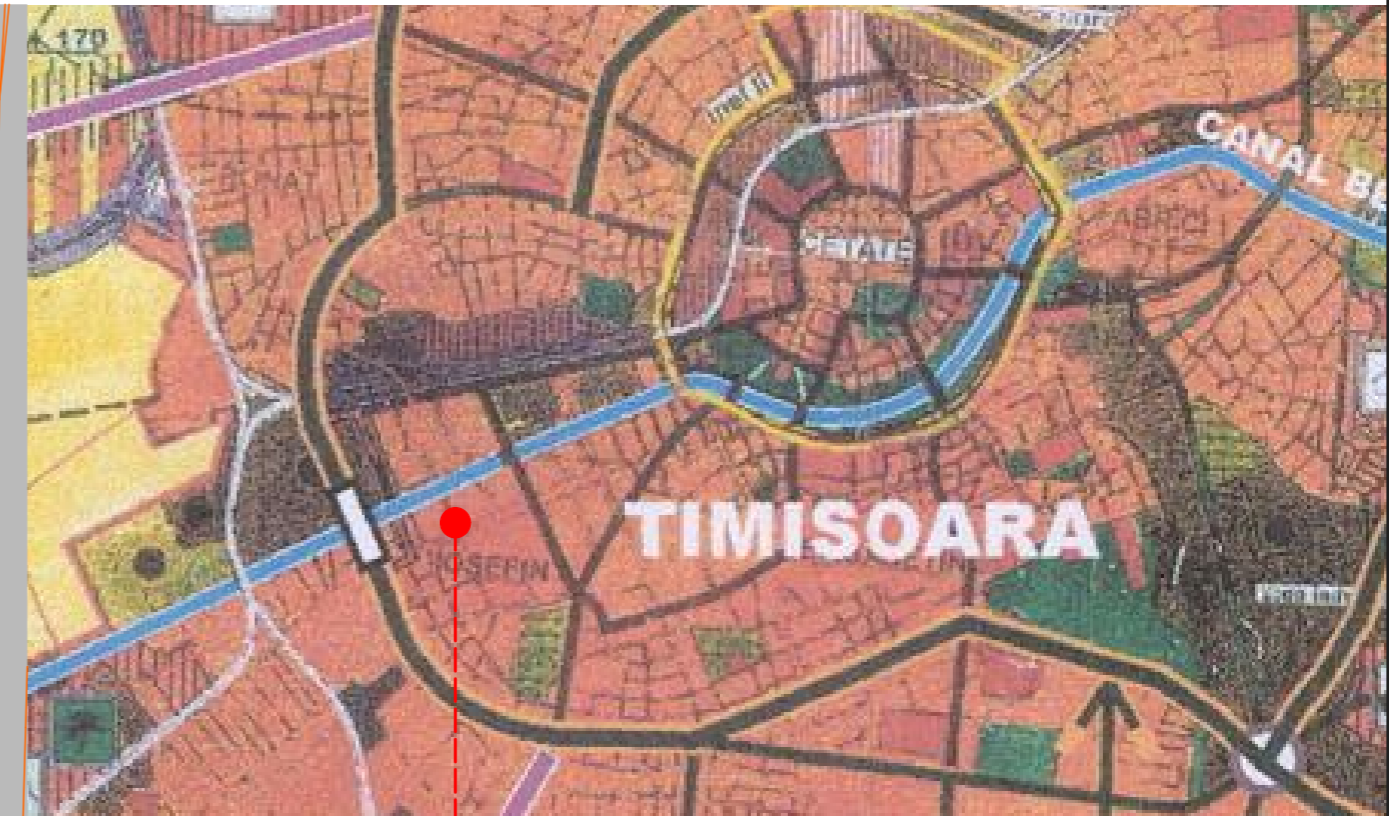
str. VULTURILOR nr. 64, TIMISOARA