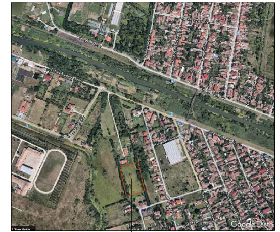
ZONA AFERENTA P. U. Z. LOCUINTE SI FUNCTIUNI OMPLEMENTARE Parcela C.F.nr.433108 Timisoara, Jud. Timis