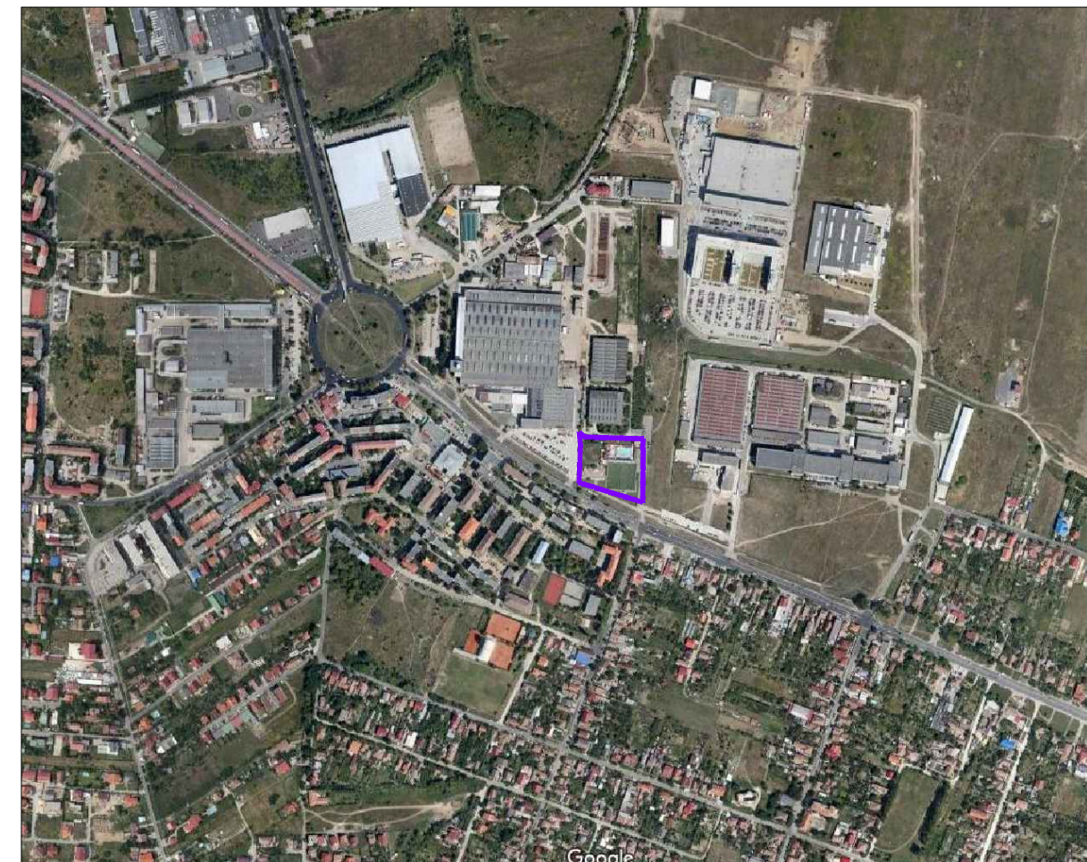
LIMITA PROPRIETATE / ZONA STUDIATA