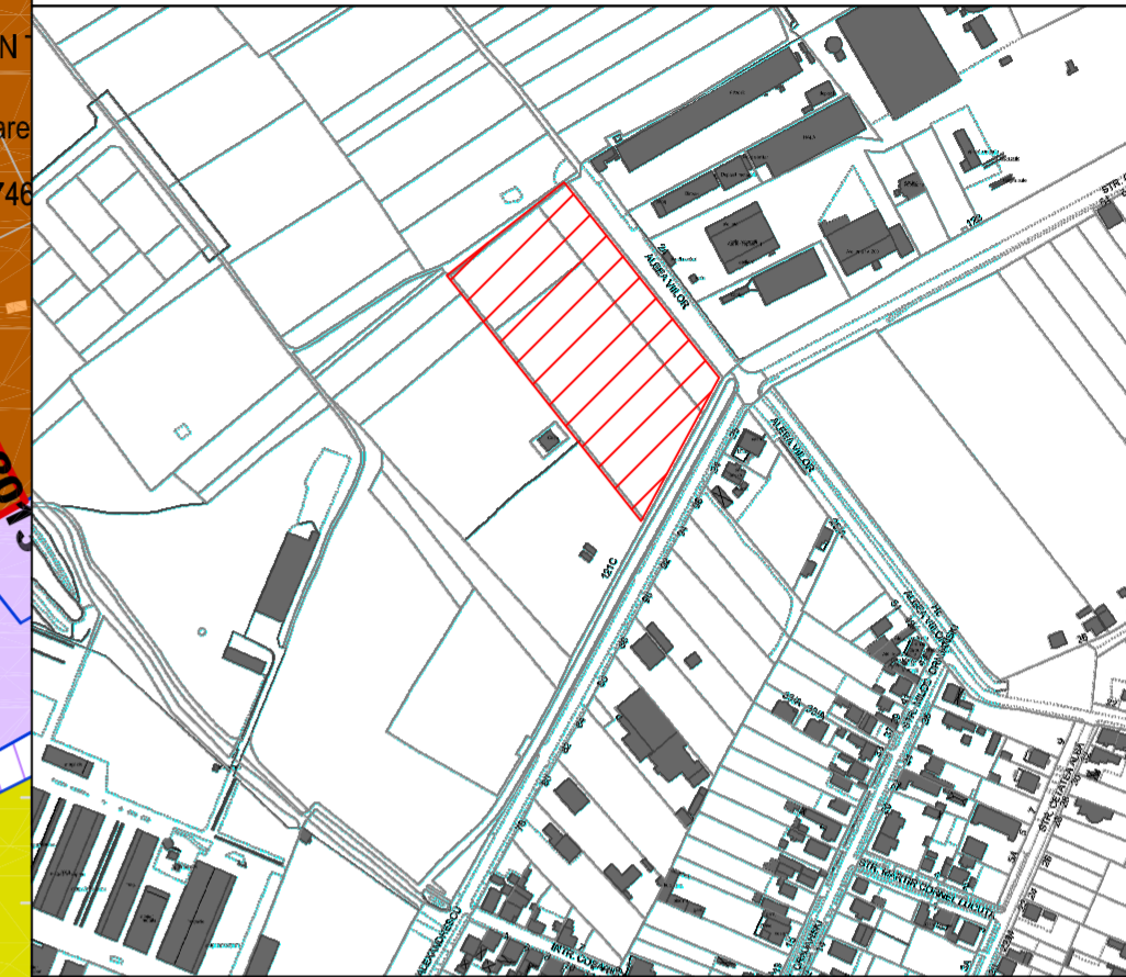
PLAN INCADRARE IN LOCALITATE